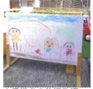
▲地域のお父さんも子どもたちも協力