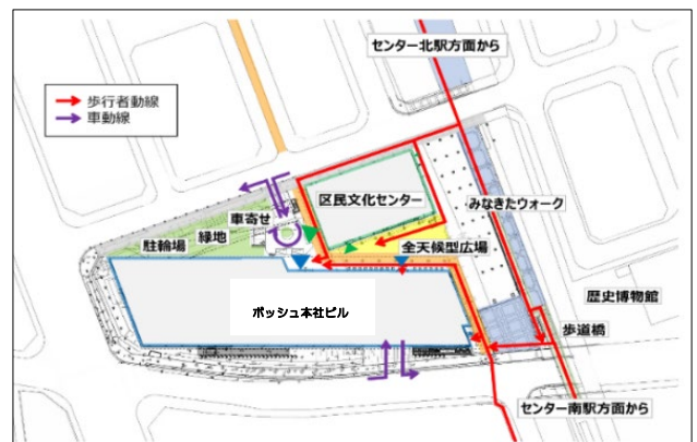
施設配置とアクセス図