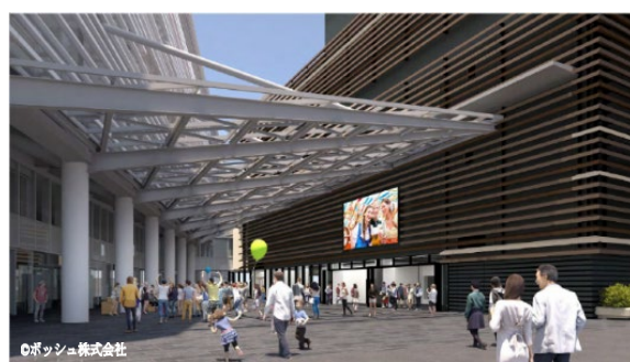
↑隣接するポッシュ本社ビルとの間に整備される 全天候型広場完成イメージ

※本資料に掲載している情報は、今後の設計などで実際とは異なる場合があります。