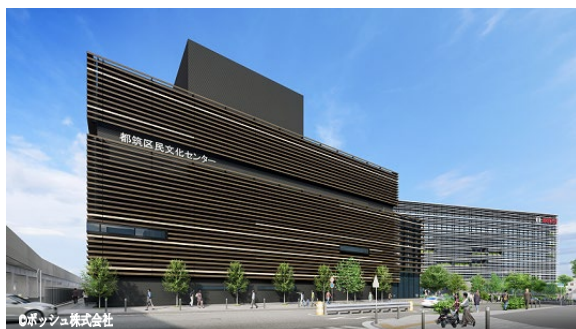
↑センター北駅側から見た施設完成イメージ (手前が都筑区文、奥の建物がポッシュ本社ビル)