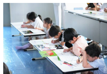
＜ボッシュ(株)による小学生向け特別授業＞ ※写真は過去実績