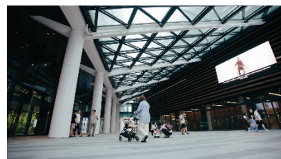
＜賑わい創出や文化振興イベント等の開催場所である全天候型広場＞