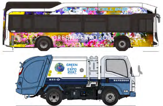
〈ラッピングバス・ラッピング収集車(イメージ)〉