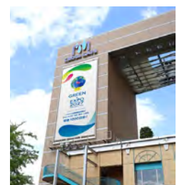
〈桜木町クロスゲート〉