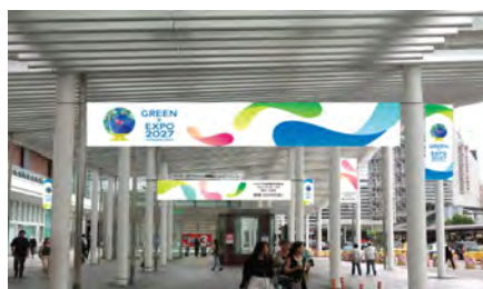
〈横浜駅西口大屋根(イメージ)〉