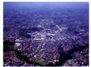
●港北ニュータウン