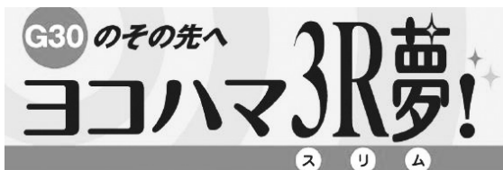
「ヨコハマ 3 R 夢！」ロゴ