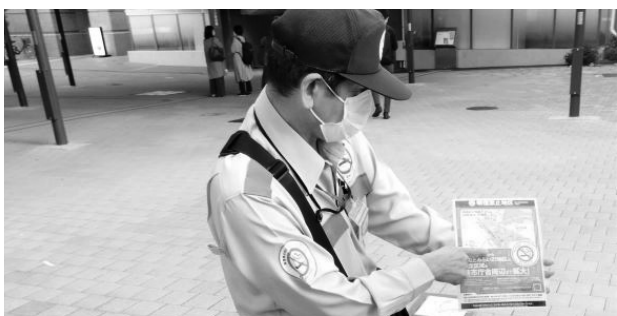
喫煙禁止地区での指導の様子