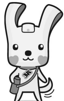
「ヨコハマ 3 R 夢！」マスコット イーオ