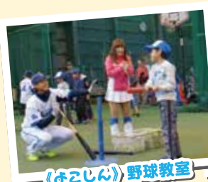
「よこしん」野球教室

芸術・スポーツ・金融経済教育などを通じて 地域の子どもたちの未来を応援しています。