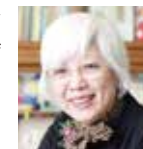
「くりとくら」の児童文学作家

子どもはお母さんのすべてが自慢なの。保育園ではお母さんの自慢大会よ。だからね、もっと自信を持って。