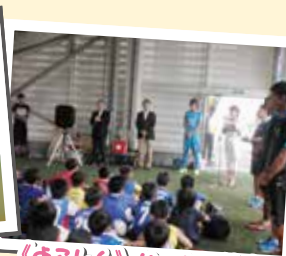
「よこしん」サッカー教室