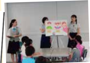
「よこしん」キッズ・マネースクール