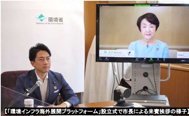
【「環境インフラ海外展開プラットフォーム」設立式で市長による来賓挨拶の様子】

企画担当 (Inquiries) 045-671-4710・ki-somu@city.yokohama.jp