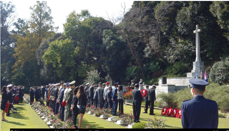
【保土ヶ谷区の英連邦戦死者墓地にて Remembrance Day Ceremonyの様子】

企画担当 (Inquiries) 045-671-4700・ki-somu@city.yokohama.jp