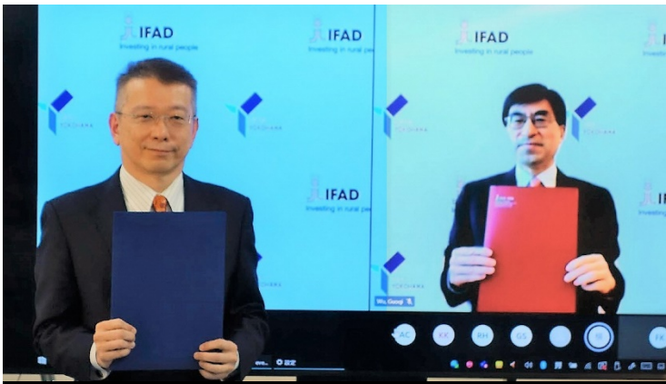
【IFAD 日本事務所の市内開設に関する覚書の調印式の様子】

企画担当 (Inquiries) 045-671-4700・ki-somu@city.yokohama.jp