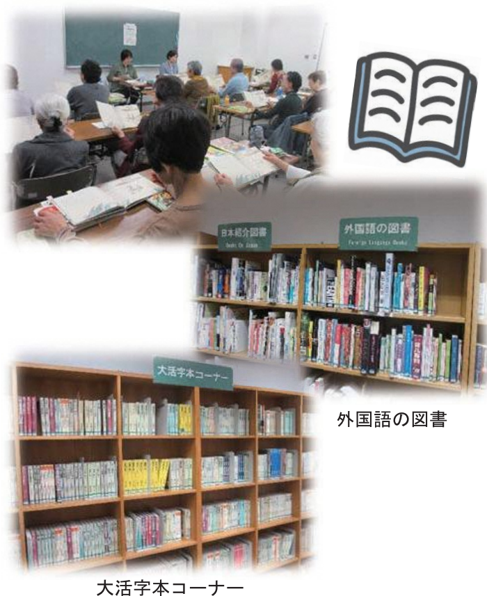
大活字本コーナー