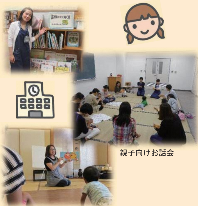
親子向けお話し会