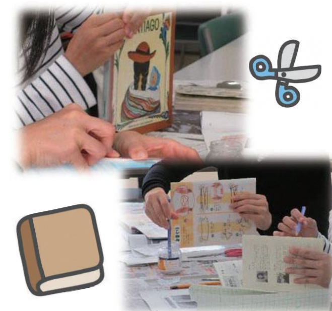
図書修理ボランティア養成講座