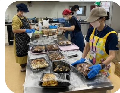
子ども食堂 ohana かわしま

おなかの中の赤ちゃんから、 就学前のお子さんご家族、 子育てを応援する人の居場所です。