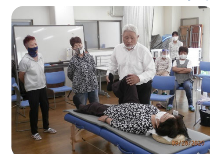
和田・釜台地区 たまり場

子ども達をより笑顔に！！が目標。 低価格でカレーライスを提供し、 地域の子どもたちが遊びに来る居場所です。