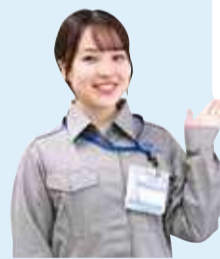
区役所 防災担当 職員

日頃から地震に備え、水や食料などの備蓄をしましょう。また、家具の転倒防止や感震ブレーカーを設置しましょう。