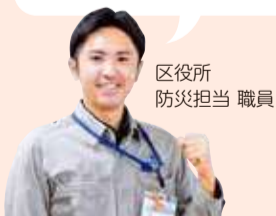
区役所 防災担当 職員

日頃から備蓄品を準備しましょう。また、地域防災拠点は地域全体で運営します。みんなで協力して避難所生活を送りましょう。