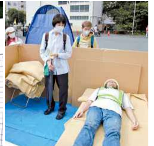
旧くぬぎ台小学校地域防災拠点訓練