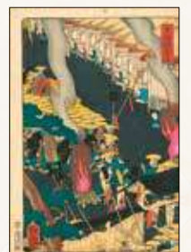
「東海道 程ヶ谷」歌川芳藤画 文久3年(1863)4月 横浜開港資料館蔵

將軍上洛という歴史的イベントによって保土ヶ谷宿が描かれ、その景観が今に伝えられることになりました。当時の社会情勢と併せてこの絵を眺めてみると、さまざまな想像をかきたてられます。