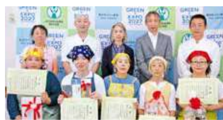
受賞者・審査員の皆さん