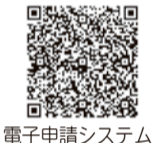
電子申請システム

申込み 12月19日までにEメールか電子申請システム 〒住所・参加者と保護者の氏名 (ふりがな)・電話番号・Eメール アドレス・学年・応募動機を明記 ※Eメールの件名に必ず「チャレンジ スポーツ」を明記してください。