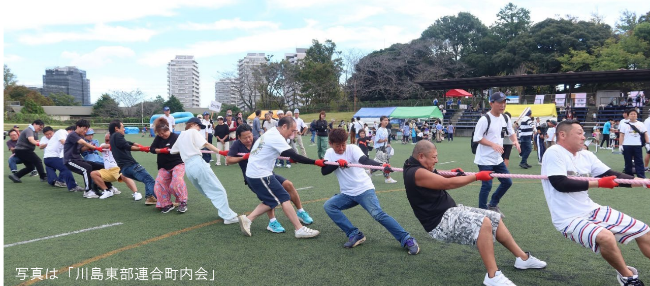
写真は「川島東部連合町内会」

優勝「中央連合町内会」、2位「川島東部連合町内会」、3位「保土ヶ谷西部連合自治会」