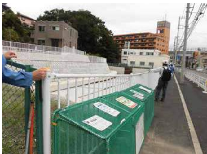
貯留施設を今井郵便局側に向かって見た工事前後の写真