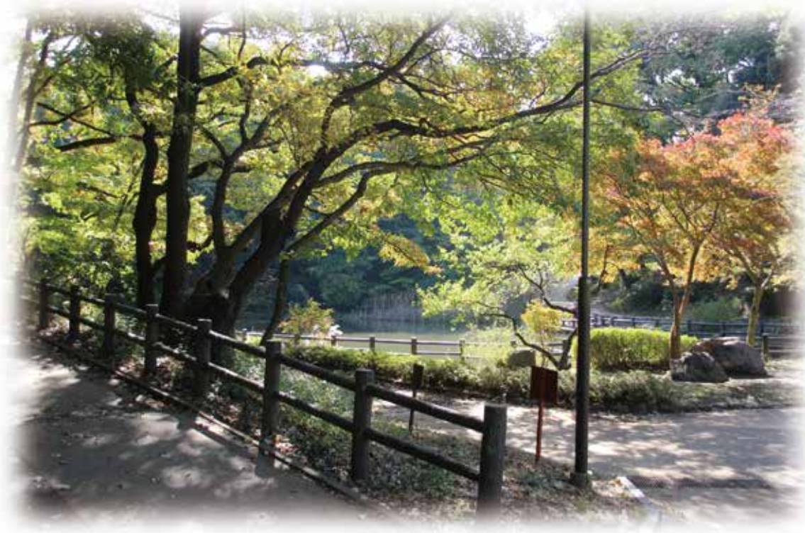
横浜市児童遊園地