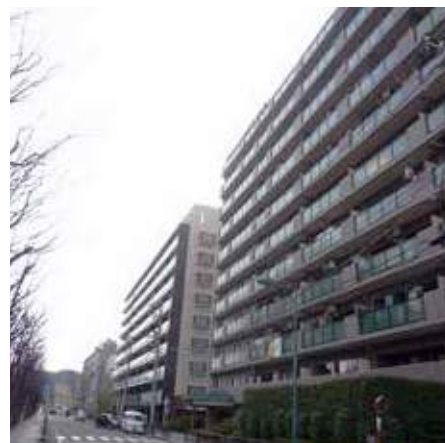
川辺町に立ち並ぶマンション群