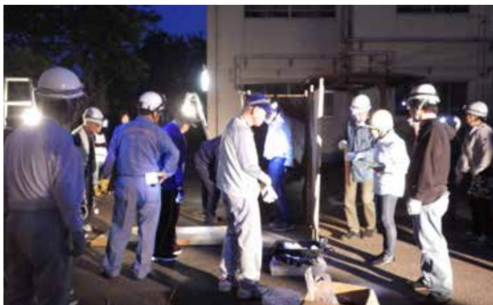
夜間訓練(トイレ組立)