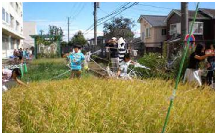
藤塚小花壇利用の田んぼ

と新しい取組が加わり、住民のさまざまな力をまちづくりにつなげ顔の見える関係が促進されました。今年度、当地区連合・地区社協は10年目を迎えます。また保土ヶ谷区は区制90周年を迎えます。この節目の年に今井の丘公園新桜ヶ丘集会所が建設され、また農園つぎの今井の丘公園も整備開園しました。新たなコミュニティ、新たな活動の広がりを感じさせる年度の始まりです。新桜ヶ丘で暮らすつて楽しいかも！