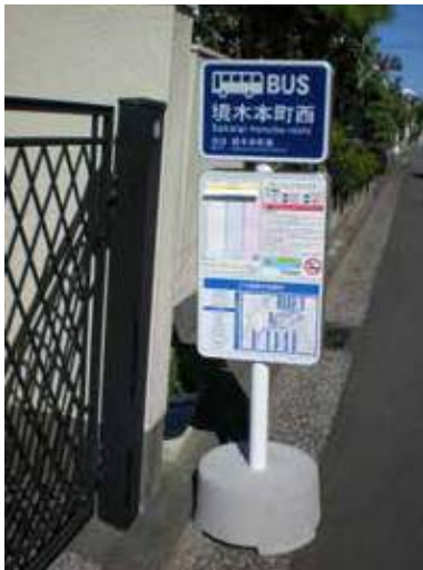
新たに設置されたバス停