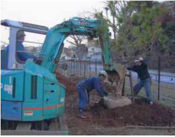
松植付け作業(瀬戸ヶ谷中橋側)