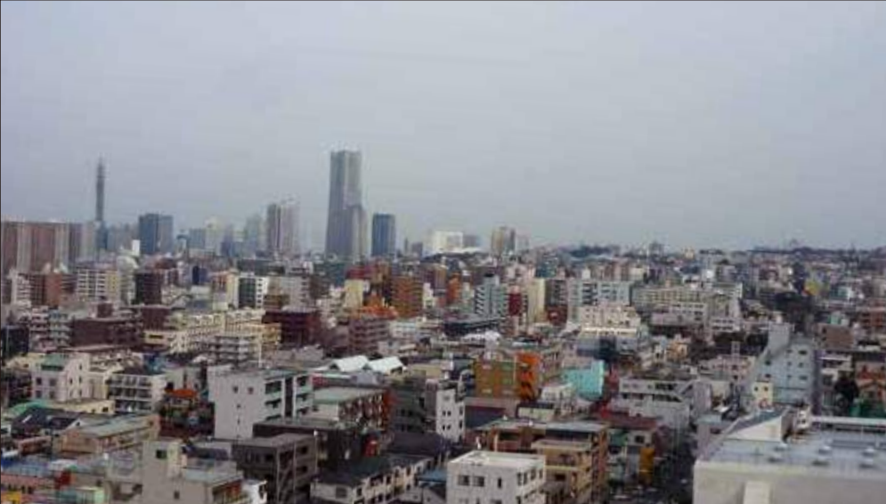
中央地区を展望する