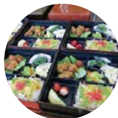
松花堂弁当に仕立てた手作り弁当