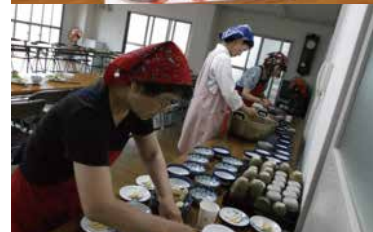
ふれあい食事と調理風景