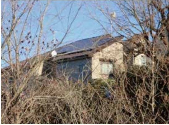
仏向町睦ヶ丘自治会館の屋根に取り付けた太陽光パネルの全景