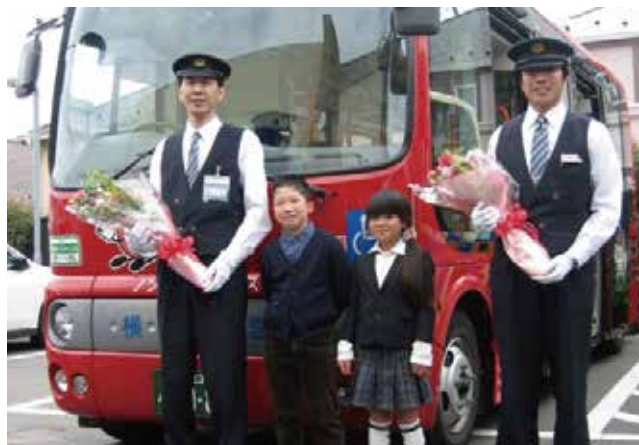
路線バス開通祝賀会(H22/3/22)バス出発時