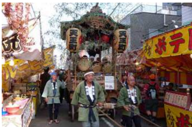
多くの人が繰り出す天王町の祭り