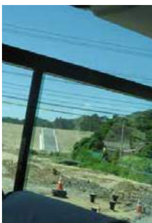
階段造成中だが、家屋の建築はない