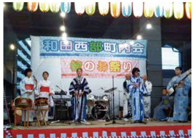
和田西部町内会の「秋のお祭り」