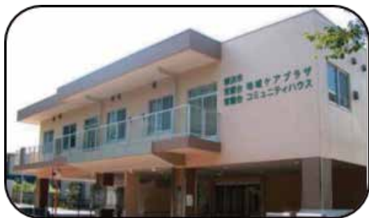
建設に当たって模型で外壁色・敷地内の緑の配置等をワークショップで検討(国大で2008年)

年にわたって努力を続けてきた賜物です。全ての活動は、この施設から生まれていると感謝しています。