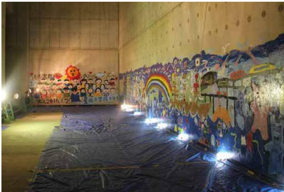
地下調整池供用前のお絵かき

そのほか、旧へそ広場にイベント・スポーツ広場のある星川中央公園が全面オープン、毎年5月の花フェスタのにぎわいも増すことでしょう。その地下には、豪雨から市民を守る容量42500 m の雨水調整池が完成、供用前には地下調整池で星川小学校児童がお絵かきイベントに参加しました。平成29年現在、調整池に接続する神戸雨水幹線を施工中です。