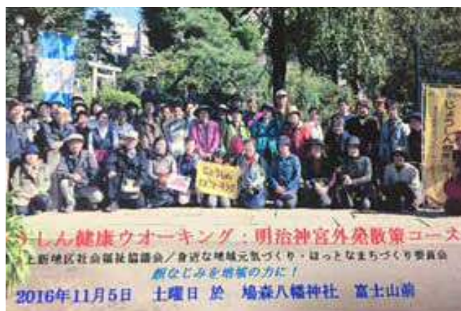
健康ウォーキング

上新地区社会福祉協議会でも「地域主体による地域の課題解決」に向け、住民が集まる機会を大切にして活動が続けております。 平成17年に行政から「ほつとなまちづくり」についての説明があり、上新地区でも委員会を立ち上げ平成18年に郷土に愛着を持つてもらおうと地域の名所史跡を訪ね歩こうと歴史探訪を行いました。この歴史探訪が好評だったことから、のちの健康ウォーキングへと活動がつながっていきました。