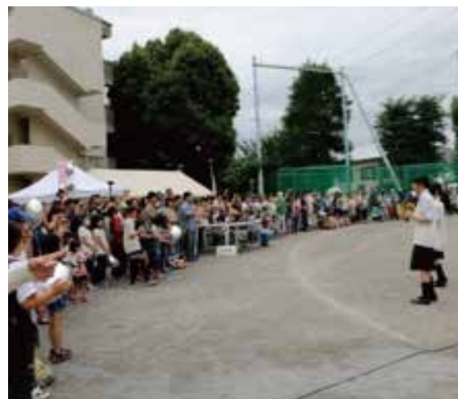
保土ケ谷中学校吹奏楽部演奏と観客

イベントは常盤台小学校のマーチングバンドの演奏でスタートし、アイスブレイクによる「玉入れ」を全員参加で競い合い、引き続きグラウンドゴルフ、手芸体験、工作・風船ロケット、