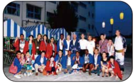
連町主催納涼盆踊りに国大留学生も参加(2009年)