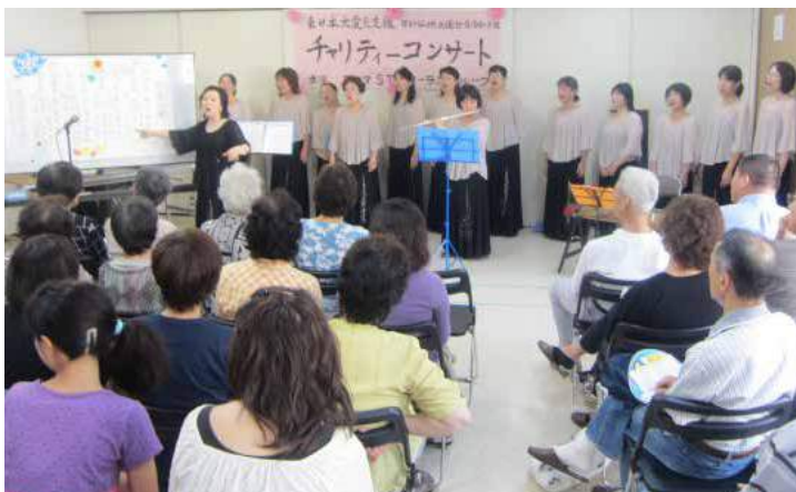
チャリティーコンサート

平成二十三年三月、東日本大震災がありました。九月に連合自治会では、衣類を集め、ダンボール箱五十箱の衣類を気仙沼町に届け、その報告