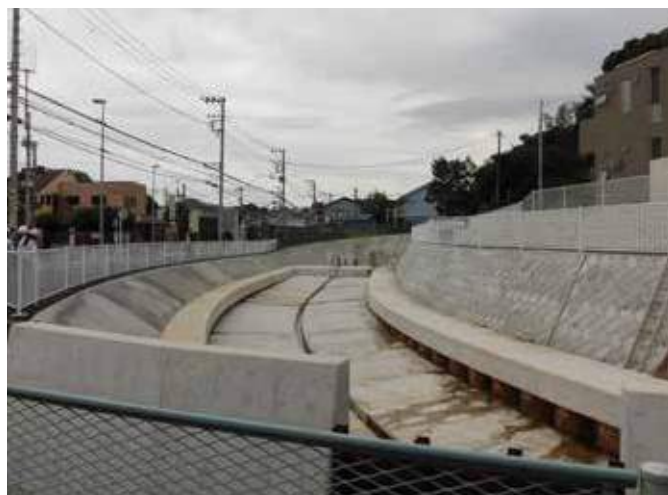
今井郵便局側から見た工事前後の写真 ～ここには従来民家が建っていました～