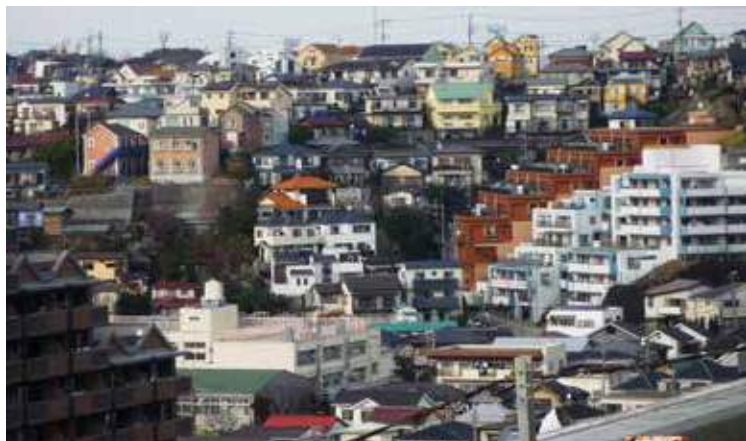
山の上まで住宅が建つ峰岡町1丁目