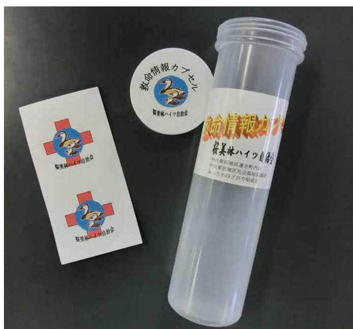
救命情報カプセル