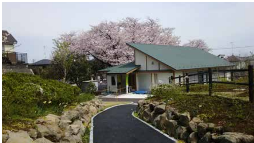
今井の丘公園新桜ヶ丘集会所