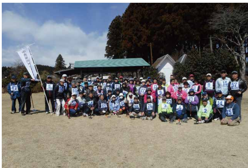
平成28年度連合町内会グラウンドゴルフ大会 平成29年3月9日 静岡県裾野市 大野路公認コース