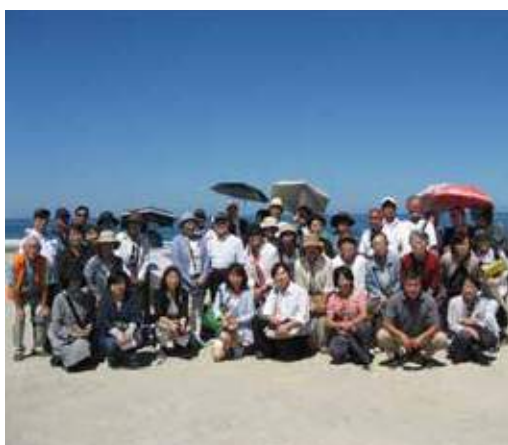
東北支援 見学台で集合写真

「本陣フレンドシップ・デー」の10周年記念事業被災地支援に参加、公営住宅薄磯団地自治会を訪れました。公営住宅の建設、宅地造成など、年を重ねるごとに復興が進んでいる様子は見られますが、被災後6年が過ぎても宅地には家が一軒も建っていませんでした。復興は途上です。千年に一度の未曾有の大震災といわれる東日本大震災の被災地支援を今後も続けていきたいと思っています。