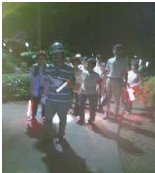
夏：汗かきかきパトロール