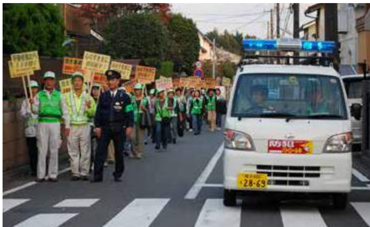
防犯キャンペーン

最初の取組として、自治会役員を はじめ委嘱委員、ボランティア団体、 市民活動団体、NPOなど地域で活 躍している人たちの活動発表や相互 交流を目的とした「地域交流のつど