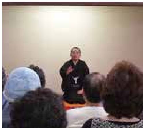
敬老祝い会の落語

地域連合としては、従来から、地域の子どもたちや高齢者が絆をもって毎日が楽しく暮らせるよう、各種クラブを開催しています。主任児童委員により、小学校の児童も参加する子育てサロンや、学援隊による小学校児童の見守りをして、積極的に小・中学校との相互連携を続けています。高齢者の楽しみのため、民生委員・あんしん訪問によるミニデイサービス食事会や楽しい敬老祝い会を開催しています。また、いつでも楽しめるパソコン教室、マーじゃん、クラフト、フラ