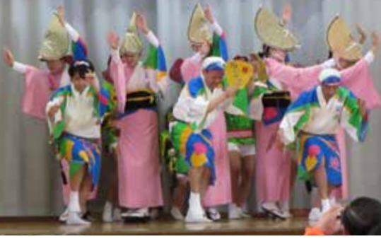
ほっとな福祉・健康まつり

■主催 上新地区社会福祉協議会、身近な地域元気づくり・ほっとなまちづくり委員会 ■後援 上新地区連自治会、保土ヶ谷区役所、伊土ヶ谷区社会福祉協議会、上新田地域ケアプラザ