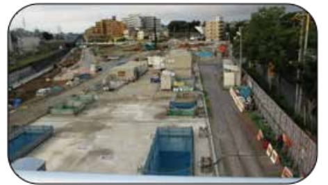
駅建設前(奥の倉庫部分2006年)

2006年(平成18年)に新線設置が発表され、2014年(平成27年)に開業が予定されていきました。その後、諸般の事情で4年先に延期され平成31年(2019年)開業の予定となりました。新駅(仮称羽沢駅)は隣区の神奈川区ではありませんが、常盤台地区は隣地ということでプラス・マイナス両面で大きな影響を受けます。マイナス部分は改善すべく関係者全員の努力が必要ですが、まずはプラス面を見て、尚一層の地域発展につなげていかなければなりません。