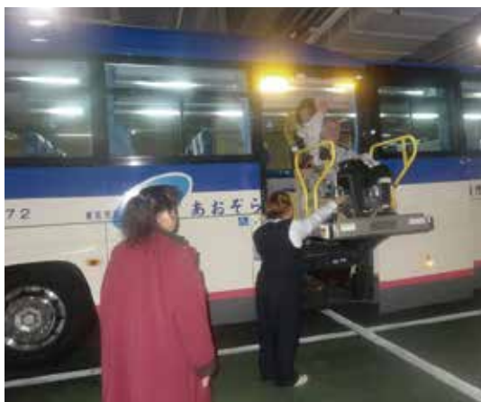
身体障害者・家族とのレクリエーション

① 地区社協が中心となり身体障害者とその家族とでレクリエーションを毎年行い、今年で31回となりました。