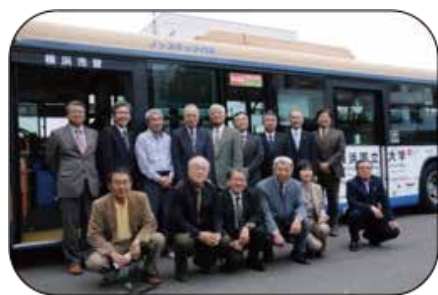
横浜国大構内バス開通1周年記念 国大鈴木学長及び全役員と連町役員(2011年)

名門ゴルフ場「程ヶ谷カントリー倶楽部」が旭区に転出(1967年)してその跡地に「横浜国立大学」が建設され、その後徐々に移転が進み、1979年(昭和54年)に完了しました。常盤台地域全体の41%を占める大学地籍、約11000名の教職員と学生数(2016年現在)との共存は欠かせない課題でした。そんな中2009年、大学の環境も大きく変わり、連町との真の交流が始まりました。現在では双方が窓口を一本化して諸問題の解決を図ると共に、毎月開催の定例会には連町の役員として大学の総務部長が出席されています。