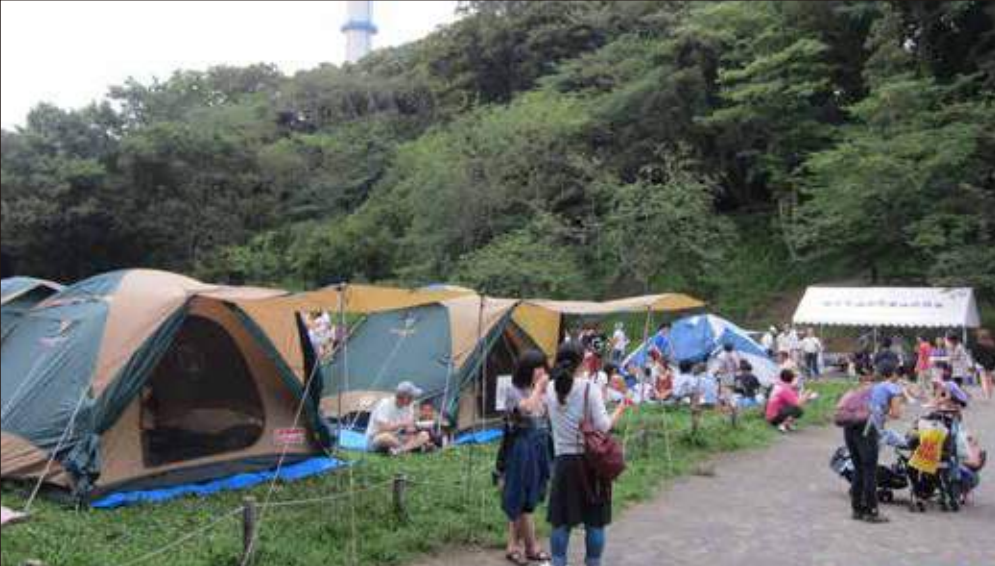
子ども防災キャンプ