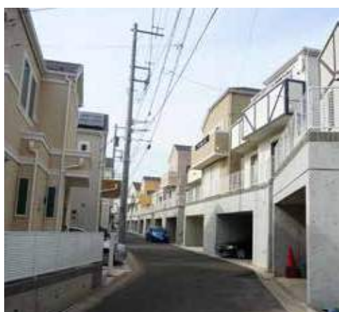
新築ラッシュの峰岡町2丁目