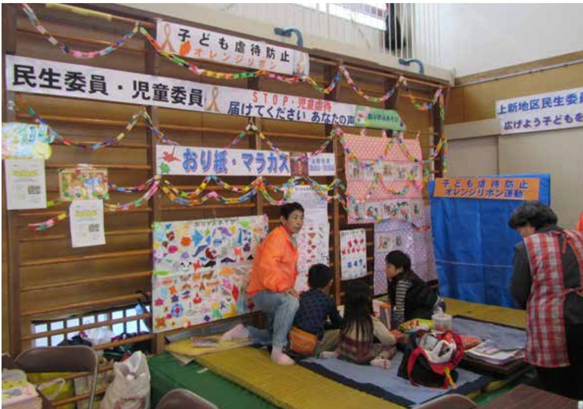
民生委員・児童委員

昨年4月1日、新井町内の2自治会のみで連合自治会を構成することとなりましたが「上新」の名をそのまま残すこととなりました。二つの自治会で連合を組んで世間並みの組織作り地域づくりができるか心配をしましたが、開けてみると、誰かがやる自治会から、自分たちがやる自治会に意識が変わってきました。これまでも増して「オール新井町」で地域福祉や自主防災などの地域課題を解決できる風土を醸成していくことにつなげることができればと考えております。