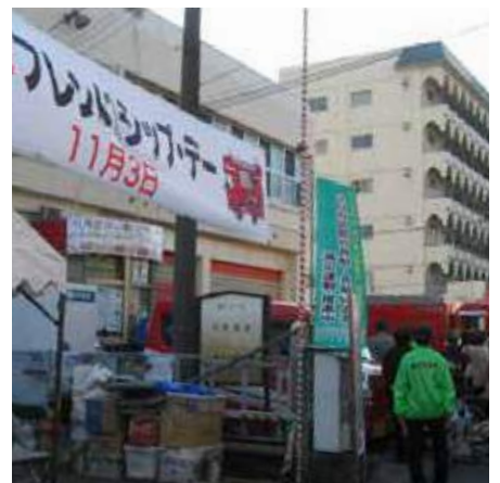
本陣・フレンドシップデー 会場風景

平成18年、保土ヶ谷消防署は地域の皆さんに出張所の存在を知ってもらうことを目的として11月3日「お出かけお迎え防災学習」を実施し、南部地区連合自治会内の瀬戸ヶ谷町自治会家庭防災員10名ほどが本陣消防出張所前でバザーを行いました。翌平成19年、本消防署が全国に先駆けて防犯機能も併せ持つ青色ボックスを設置し、式典の様子はNHKニュースなどでも紹介されました。式典当日の11月3日、本陣出張所前では「本陣フレンドシップ・デー」の前身というべき自主防災事業を開催。南部地区連合自治会では家庭防災員、民生委員他各委嘱委員が参加・協力し、以後、毎年参加しています。平成20年、当時の本陣出張所長が自主防災事業を「本陣フレンドシップ・デー」と命名。さらにこの年、横浜市消