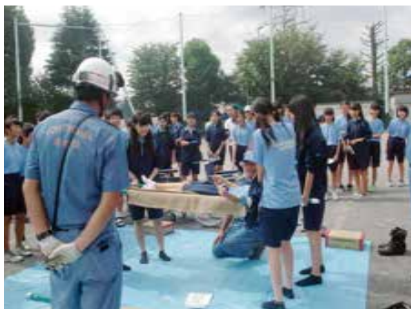
中学生による担架運び訓練

地域防災拠点での防災訓練では、保土ケ谷中学校の2学年全員が参加し、地域防災に貢献する意識を高めています。参加者は中学生に加え、地域住民、行政関係者も参加しました。