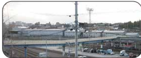
地下施設(ホーム・トンネル)は完成し 駅舎と構内施設の建設を待つ(2016年)