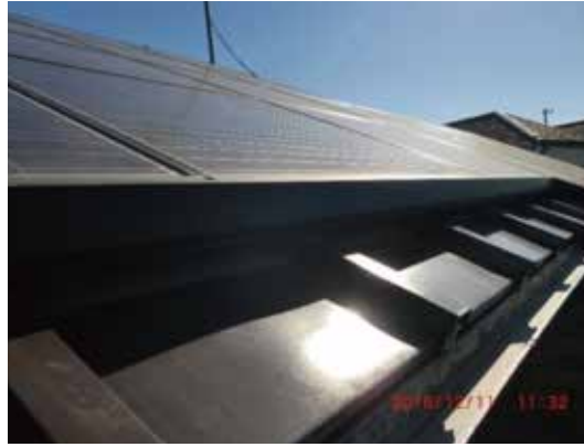
仏向町睦ヶ丘自治会館の屋根に取り付けた太陽光パネル

しました。横浜市が平成21年度自治会・町内会に「太陽光発電助成制度」を4棟分子算化され、その1棟分を利用しました。