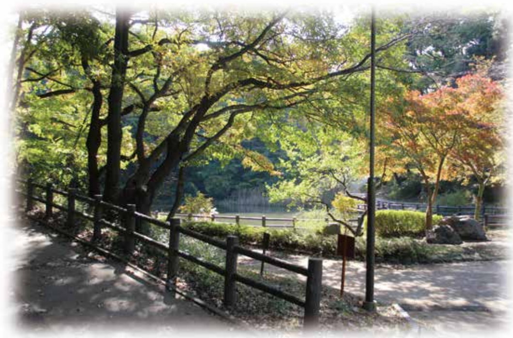
横浜市児童遊園地