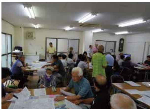
ワールドカフェでの話し合い風景