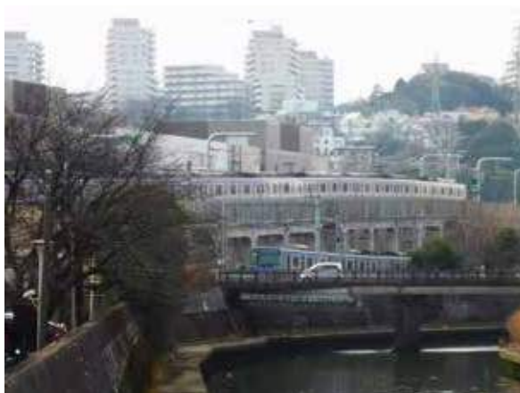
実現した相鉄線下りの高架化と現状の上り電車