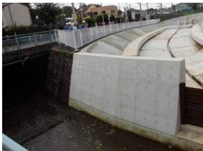
今井橋を上流側から見た工事前後の写真