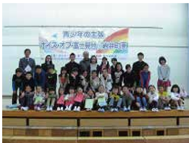
Wボイス・オブ・富士見台☆岩井町