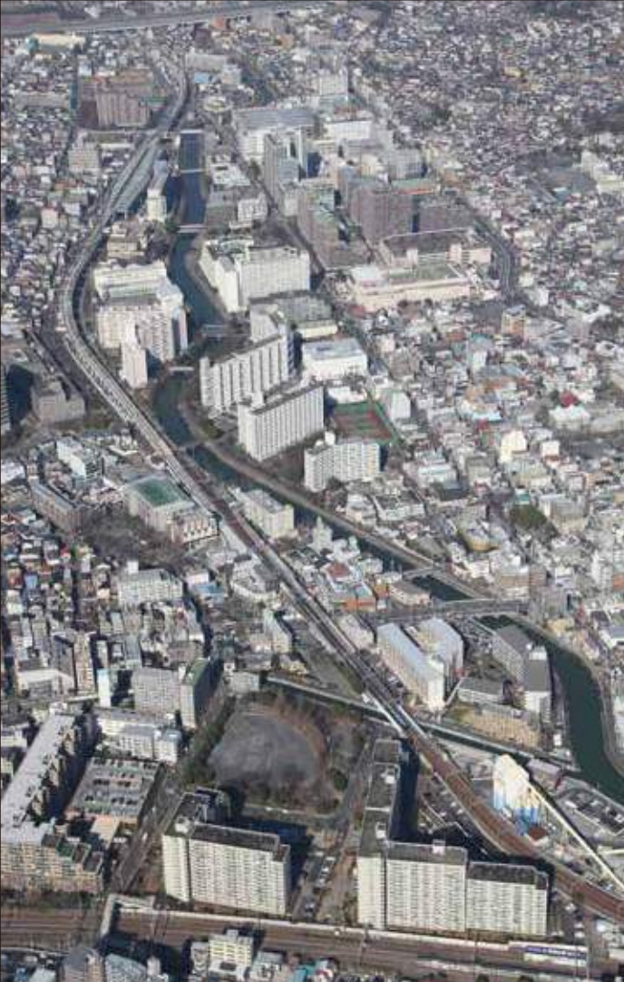
空から見た岩間地区

宅街と高層住宅、ビジネスパー クと、多彩で便利なまちで、1万世帯 以上、2万人以上が暮らし、若年層 が平均より多いものの高齢化も進 んでいます。