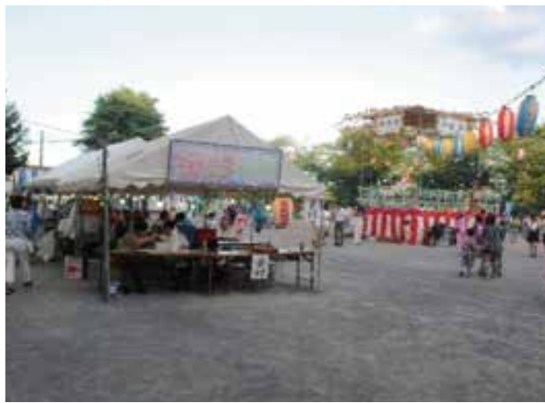
釜台町自治会の「納涼祭」