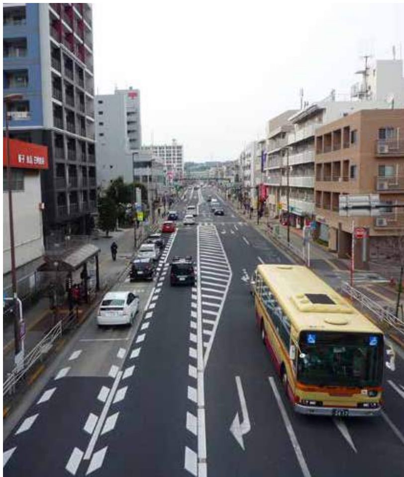
中央地区内を通る国道16号（無電柱化でスッキリ）

それ以外は戦前に成立した歴史あるまちでもあるところから、ゆつたりした人情厚い住みやすい地域ですが、年々高齢化率が高くなり75歳以上の