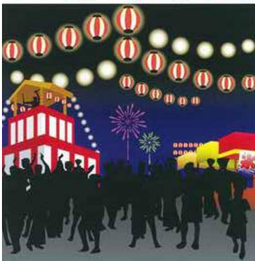
【保土ヶ谷区地域・まちづくり活動支援事業】