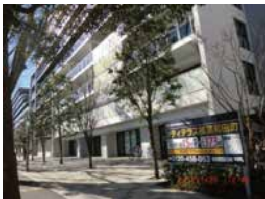
高層マンション(シティテラス)