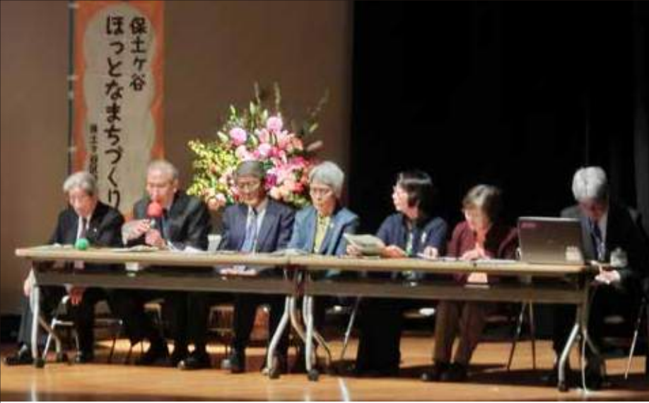
ほっとなまちづくりフォーラムで発表

そのほか、旧へそ広場にイベント・スポーツ広場のある星川中央公園が全面オープン、毎年5月の花フェスタのにぎわいも増すことでしょう。その地下には、豪雨から市民を守る容量42500 m の雨水調整池が完成、供用前には地下調整池で星川小学校児童がお絵かきイベントに参加しました。平成29年現在、調整池に接続する神戸雨水幹線を施工中です。