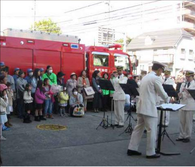
本陣・フレンドシップデー 消防音楽隊による記念演奏

餅つき大会は、前日に70キロのもち米を研ぎますが、この量は地区最大です。当日は9時に男性が火熾し、10時から餅つきを開始します。餅つきは男性だけではなく、女性のとび入りもあり、和気あいあいとして盛り上がります。11時頃から集まった子どもにも、子ども用の杵で餅つきを体験。つき終わった餅はお供え餅、女性が「きな粉餅」「大根おろし絡め餅」にして、集まった方々にお汁粉を作り配ります。役割はほぼ5自治会で決まっています、もち米を蒸す係、手返し、餅をつく係、子どもの持ちつき手助け、大根おろし係など手馴れたもので、新しく参加した方も自然にできるようになっていきます。