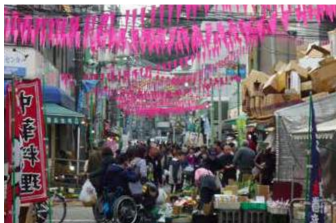
買い物客で賑わう松原商店街(宮田町)