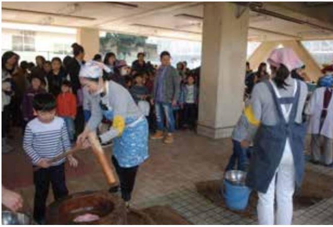
釜台町自治会子ども餅つき風景

会の共催で行い、町内の小学生以下の子ども100名近くが全員餅つきを経験します。和田西部町内会では、餅米200kgをつき、付き手や手返しの手張りは相当なものです。