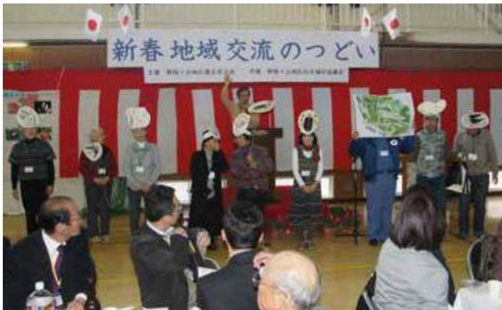
つどい活動発表風景

コミュニケーションの一端を担ってい た、二丁目、二丁目にあった個人商 店の減少による商店会の解散。また まちのシンボルであった桜並木も老 齢化によって伐採されるようにな るなど、まち全体に活気が感じられ なくなってきました。このように生 活環境が変化する中でまちを維持 していく問題解決のため、コミュニ ティを再構築する時期がきていま した。特に福祉的課題は多様化し、 より強い顔の見える関係づくりが