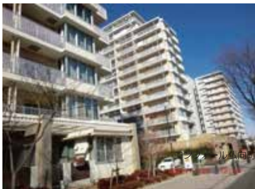
コンフォール仏向町