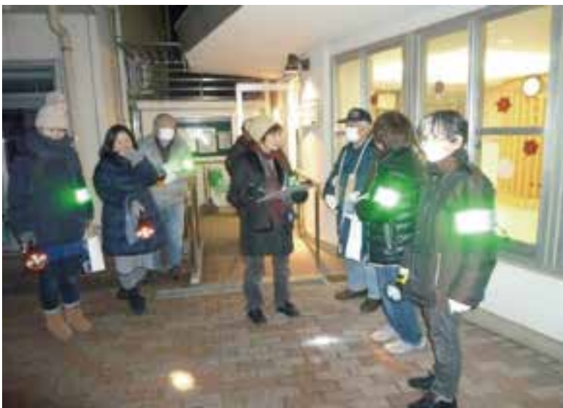
冬：出発前の準備確認

親睦の絆を通して地域の安全安心を担保するための防犯防災路上駐車パトロールを20年にわたり継承し、月1回の地道な夜間パトロールには警察、消防、行政と共に協力し合い、域内の路上駐車車両ゼロ地域まで、住民の協力で成し遂げられました。