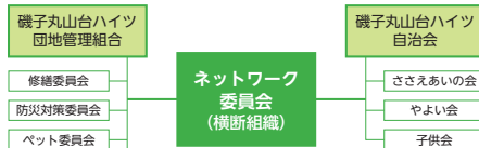
ネットワーク委員会は団地の管理組合と自治会との横断組織となっています

団地の管理組合と自治会の横断組織で、継続的にICT化に取り組んでいます。現在は、区の相談会や出張講座を活用しながら、Googleサイト等を活用した自治会ホームページの新規作成の準備や資料のデジタル化(自治会と管理組合を横断する委員会の資料をデジタル化することで整理する)等に取り組んでいます。