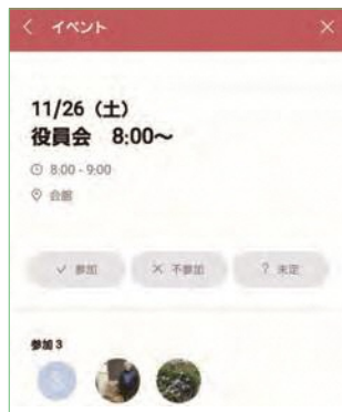
役員会の日程調整や参加者確認はLINEグループのイベント機能を活用しています