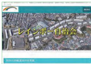
自治会ホームページには、防災拠点やハザードマップ、子育て支援マップなど役立つ地域情報へのリンクがあります

自治会ホームページには、活動内容やイベントの開催案内だけでなく、各種申請書類なども掲載していて、自分のパソコンに保存できるようにしてあります。