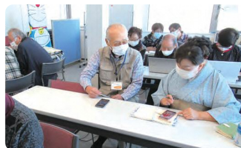
いそご区民活動支援センターで開催されているパソコンやスマートフォンの相談ができる講座