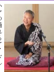
ハマの踊れないアイドル 秋風亭借金

お楽しみ演芸会 日 時：2020 年 11 月 22 日(日) 12 時開場 / 13 時開演 ※終演 16 時予定 会 場：杉田劇場 木戸銭：1,000 円 定 員：140 名 ※事前申込制 / 予約受付先着順 主 催：磯子区文化協会 演劇部