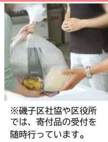
※磯子区社協や区役所では、寄付品の受付を随時行っています。