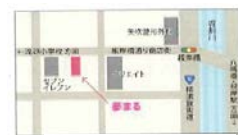
「根岸橋」バス停より徒歩1分 ※駐車場はありません

◆子育て世帯の方、一人暮らしの学生さん... どなたでもお気軽にご連絡ください ◆事前にお申込みください