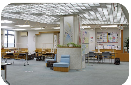
杉田地区センターロビー

幼児から高齢者の方まで、趣味や文化、レクリエーション、生涯学習など様々な活動を通じて地域の相互交流の場として気軽にご利用いただける施設です。