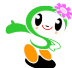
磯子区キャラクター いそっぴ