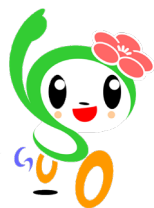
磯子区キャラクター「いそっぴ」

会員を増やしたい、グループの活動を広報したい、いきいきふれあい活動広場を利用したいなど積極的に活動したいグループ・団体の皆さんがご登録されています。詳細はお問い合わせください。