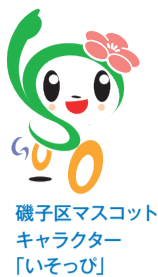
磯子区マスコット キャラクター 「いそっぴ」