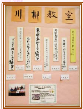
泉いきいき展での展示作品