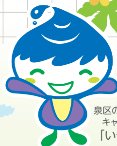
泉区のマスコット キャラクター 「いっずん」

地球温暖化・ヒートアイランド現象抑止の取組の一つとして、「緑のカーテン」普及のためのコンテストを開催します。皆様が愛情込めて栽培した「緑のカーテン」の写真をぜひご応募ください!!