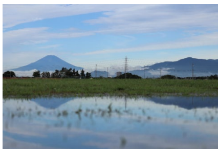
富士山と丹沢山塊（深谷通信所跡地）