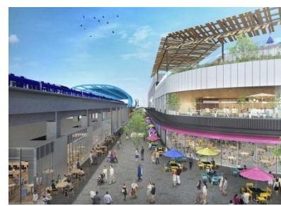
ゆめが丘大規模集客施設完成予想パース図