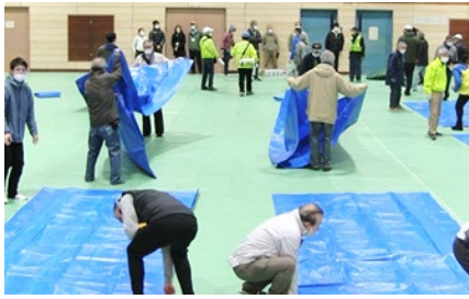
＜領家中学校におけるモデル防災訓練＞

防災に関する「自助」「共助」の意識醸成を図るための広報・啓発や、次世代の担い手育成支援を行うとともに、関係機関と連携し、区の防災体制の強化を図ります。また、防犯対策、感染症対策など積極的に取り組み、安全に安心して暮らせるまちづくりを進めます。