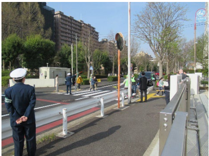
＜交通安全キャンペーン＞

地域・団体・事業者の自主防犯活動を支援するとともに、防犯に関する啓発活動や講習会等により、区民の防犯意識の向上を図ります。また、登下校時間にパトロールを行うことで、児童や生徒を狙った犯罪を未然に防ぎます。