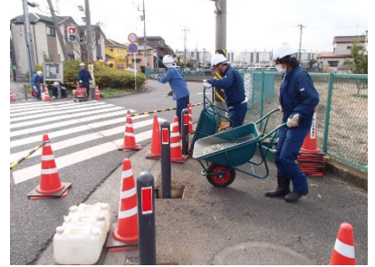
<土木事務所の作業風景>