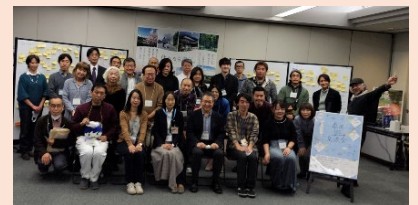
<SNS フォロワー等交流会 (R4.12.10 実施) >

令和4年度に区公式 SNS フォロワーや地域ライター等「泉区ファン」が集まり、泉区の魅力について語り合う交流会を実施しました。このネットワークをさらに広げ、泉区に関わる様々な方たちと泉区の魅力を発信していきます。