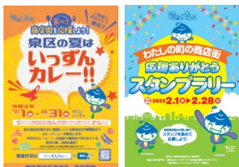
<商店街イベントの例(R4)>