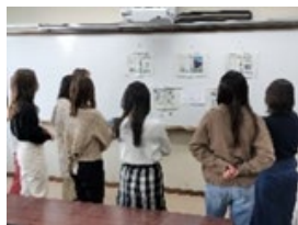
<フェリス女学院大学との連携による シェアサイクルフリーフレットと制作検討中 の様子(R4)>