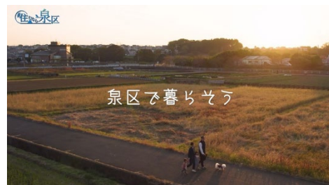
<プロモーション動画>

「泉区に住み続けたい」「住むなら泉区」と感じていただくため、区民や事業者の皆様をはじめ、一般募集した地域ライター、泉区公式 SNS フォロワーなど泉区にかかわる多くの方々と連携し、泉区『愛』に溢れるプロモーションを展開します。