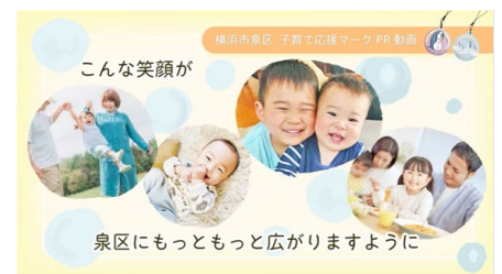
＜子育て応援マーク紹介動画＞

子育て世代が地域に見守られ、孤立せずに子育てができる地域づくりを目指し、地域で身近に相談できる「子育て応援サポーター」を育成します。また、子育てを応援したい人と応援してほしい人の出会いのきっかけを作る「子育て応援マーク」等の配布を行うとともに、広く区民が目にする場で紹介動画を配信していきます。