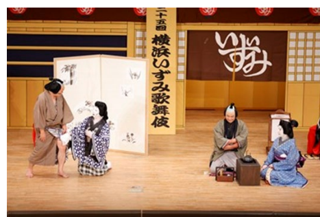
<横浜いずみ歌舞伎(R4)>

相鉄・東急新横浜線の開業と、ゆめが丘大規模集客施設の開業を踏まえ、相鉄グループや地域の皆様と連携してイベントを開催します。これにより、賑わいの創出と更なる魅力の向上を図り、居住地として選ばれるまちづくりを進めていきます。