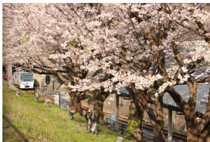
桜の下を走る相鉄線（弥生台駅）

泉区は、水と緑にあふれ、地域活動が盛んな魅力あるまちです。また、令和5年3月には相鉄・東急新横浜線の開通、令和6年夏にはゆめが丘大規模集客施設の開業など、更なる賑わいの創出・発展が見込まれています。地域の皆様に「泉区に住み続けたい」、「住むなら泉区」と実感していただき、「子育てに優しいまち泉区」を目指し、未来へ向けたまちづくりを進めていきます。