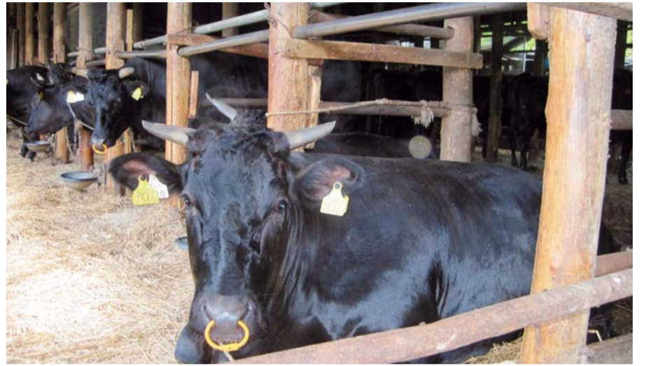
▲黒毛和牛を育てるには接触が大切。声をかけ、ビールを飲ませます。ビールは胃袋が膨らむので食欲を増進させる効果があるそうです

泉区ファーマーズマーケット“ハマッ子”で話題を集める、横浜産の黒毛和牛。酪農家グループは横浜中央卸売市場食肉市場に月6〜8頭を出荷します。月に1〜2回その牛1頭が丸ごと精肉となってハマッ子に届きます。「A5ランク*のものが出たこともあります。高い格付けの肉が手頃な値段で手に入ると広まり、最近はハイキング姿の方も立ち寄って買っていきます」(ハマッ子の磯貝店長)。