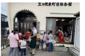
「食品頒布会」の様子