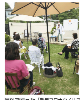
屋外で行った「新型コロナウイルス感染症対策セミナー」の様子

イベントの開催予定だった6月ごろは不安で外出したくないという雰囲気が漂う中、「イベントを開催するには、マスク着用、体温測定、手の消毒、座席の間隔、風向きなど、できる限りの対策をすれば屋外なら大丈夫」という専門医のアドバイスをもらい、実施しました。今後もコロナの状況を見ながら、気持ちの良い屋外でのイベントを考えていきたいです。