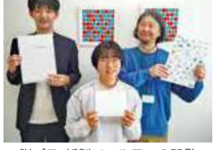
脱プラ・紙製ノベルティの開発

●企業の脱炭素化の取組の足掛かりに 長年自社工場で環境問題に取り組んできたノウハウを生かし、企業のサステナビリティレポート作成等のコンサルティングをしています。