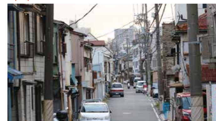
撮影場所：子安周辺