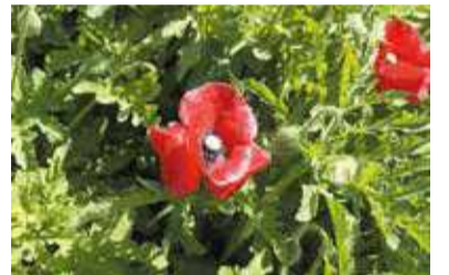
▲植えてもよいヒナゲシ