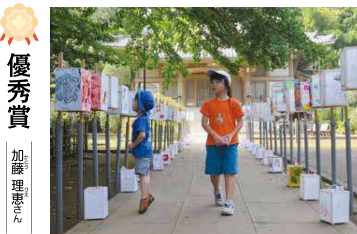
撮影場所：豊頭寺(三ツ沢西町)

見た人が春の到来を感じ、ここに行きたいと思うような季節感あふれる素晴らしい作品です。技術的にも背景のボカシ方などが絶妙です。