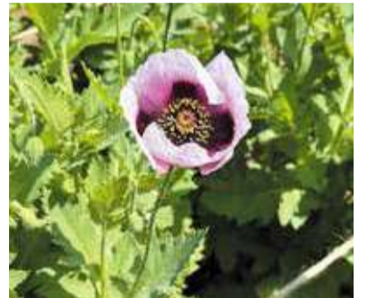
▲植えてはいけないアツミゲシ