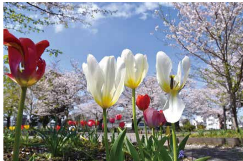
撮影場所：幸ヶ谷公園