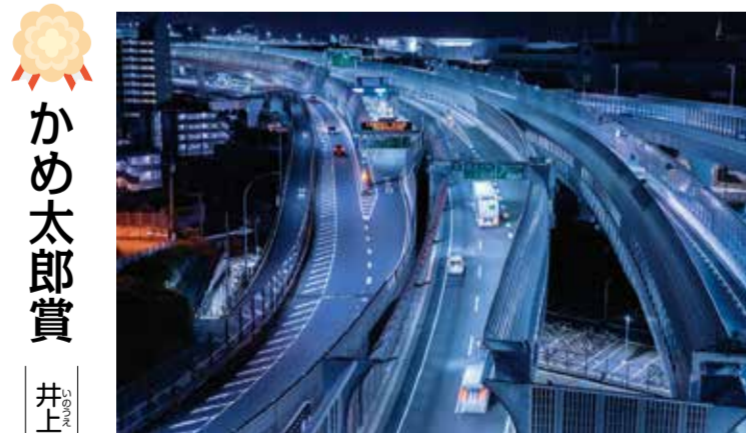
撮影場所：子安台公園

朝日が昇る少し前の河口の橋の陽の勢いと、船出を待つ船のエンジン音が静かに響く朝の橋の堂々とした姿を見てほしいです。