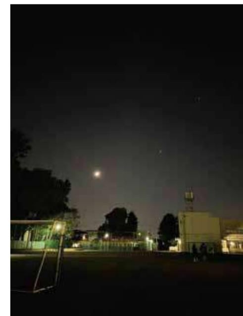
撮影場所：神橋小学校