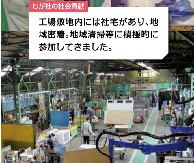
広い工場の中、作業を分担し製品を完成させていきます