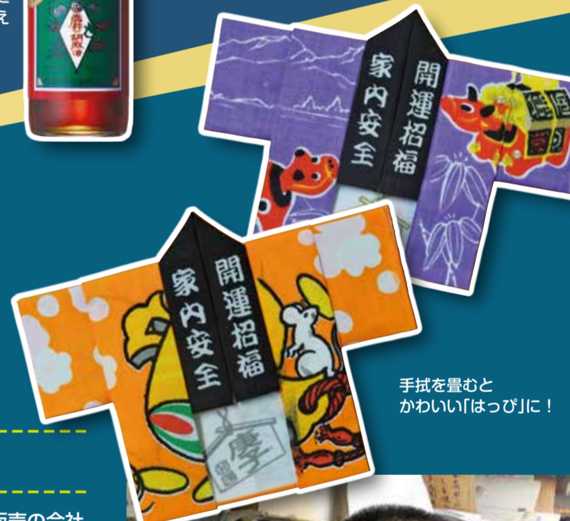
手拭を畳むとかわいい「はっぴ」に!

伝統技術を伝えるため、町の先生として区内中学校の生徒に本染めの体験を行ってきました。