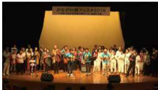
かながわ湊フェスタ2019の様子

「かながわ湊フェスタ」は区内の市民活動団体や生涯学習団体等の皆さんによる、ステージ発表、体験コーナーやワークショップなど、大人も子どもも楽しめるイベントです！ぜひ、ご来場ください。