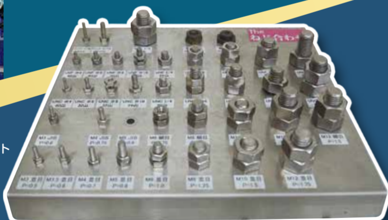
同じ種類のボルトでも長さや大きさは何通りも