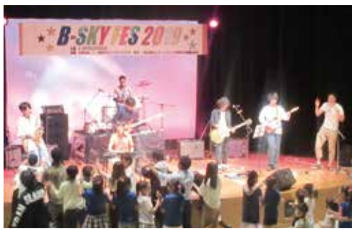
B-SKY FES 2019の様子

今回はオンラインでの開催となりますので、皆さんの日頃の成果を5分以内の動画にして送っていただいたものを、まとめてYouTube上で発表します。