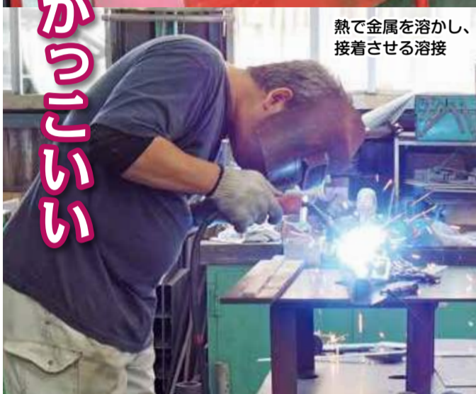
熱で金属を溶かし、接着させる溶接