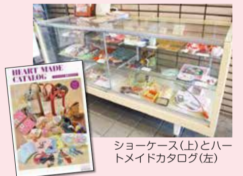
ショーケース(上)とハンドメイドカタログ(左)

区役所での販売回数は限られていますが、個別の販売や、「イベント用にまとめた数が欲しい！」などのご注文も相談できます。ほかにもたくさんの製品が「ハートメイドカタログ」に掲載されていますので、こちらでもご覧ください。