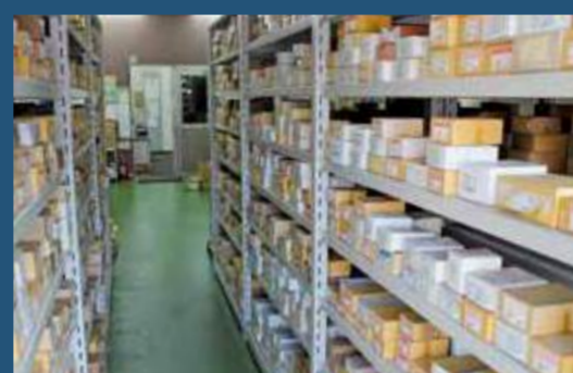
所狭しと並ぶネジ・ボルト。数えきれない種類の中からお客様が求めているものを提供します