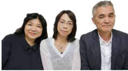
(主任児童委員連絡会)

主に子どもに関する支援を行う民生委員・児童委員*です。区役所や児童相談所、学校などと連携をしながら、地域の子どもたちが健やかに過ごせるよう活動しています。