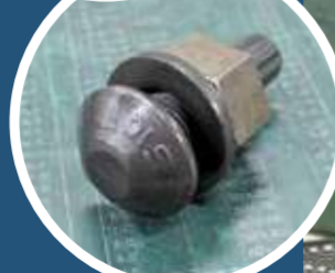
橋などの構造物に使われる高力ボルト。私たちの生活を支えています