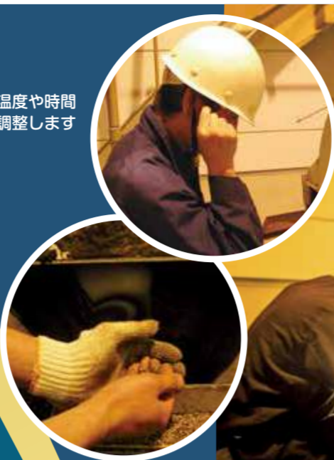
焙煎の温度や時間は毎日調整します