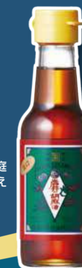
コロナ禍で家庭用の需要が増えています

压榨製法にこだわり、化学的製法は一切採用していません。搾油された後も遠心分離機は使用せず2週間静置し、不純物を沈殿・分離させ、上澄みを濾過し、不純物を完全に除去しています。手間は掛かりますが、その分雑味のない、風味・香味抜群の胡麻油を生産しています。