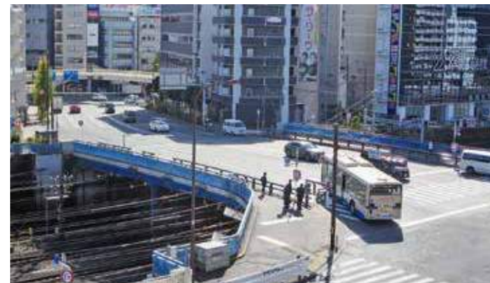
あおきぼし 青木橋 鋼橋 青木町 / 1928(昭和3)年竣工・橋長37.9m

本覺寺のある丘と幸ヶ谷公園のある丘は元々ひと続きでした。この丘を切り開き、1872(明治5)年に新橋—横浜間に鉄道が開通。この工事に伴い、線路をまたいで旧東海道を結んで架けられたのが青木橋です。橋名は町名に由来しています。 町名の由来▶青木町は洲崎大神の神木「榎」に由来するとされています。