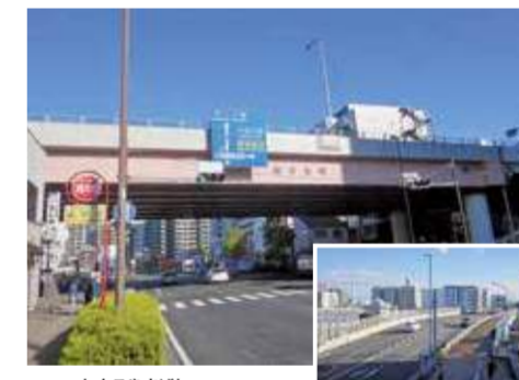
しんこやすばし 新子安橋 混合橋 新子安一丁目 / 橋長663.2m

山下長津田線や東海道新幹線をまたぐ橋。市内の道路橋のうち最も長い橋です。「JR新横浜駅」方面や国道16号方面への行き来が便利になりました。