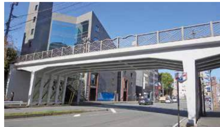
かみだいばし 上台橋 コンクリート橋 台町 / 1956(昭和31)年竣工・橋長27.6m

「神奈川宿歴史の道」はこの上台橋から始まります。かつてこのあたりは、潮騒の聞こえる海辺の道でした。この地に橋ができたのは1930(昭和5)年。その後開発が進み、切り通しの道路ができるとともに、その上に現在の橋が架けられました。欄干には青海波のデザインが施されています。