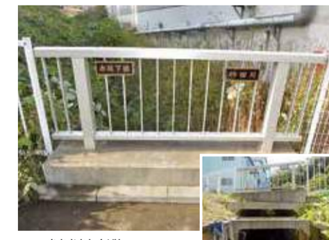
あかさかしもじょう 赤坂下橋 コンクリート橋 菅田町 / 橋長1.9m

JR、京急、国道、首都高をまたぎ、臨海部と内陸部を結び、物流において重要な橋。さらに海側に進むと恵比須橋があります。