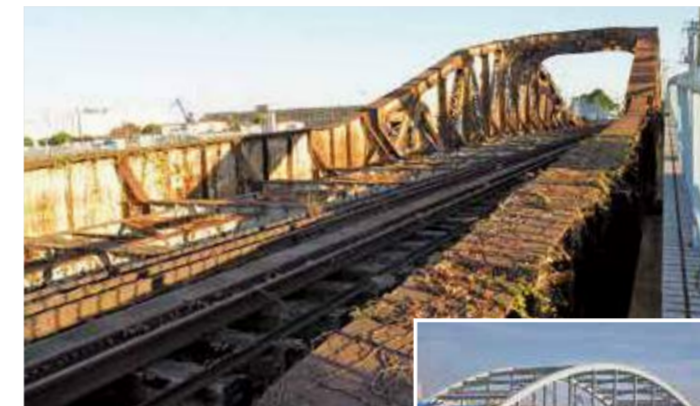
みずほきよりりょう 瑞穂橋梁 鋼橋 橋本町2丁目 / 1934(昭和9)年竣工・橋長77.2m ▲瑞穂橋

国内最初の溶接鉄道橋。溶接の技術は、船を造る分野から始まり、橋の技術にも広まりました。現在は隣に瑞穂橋(道路橋)が架けられ、この鉄道橋は利用されていません。橋全体が赤茶色にさびて歴史を物語っています。長い間、米軍施設「横浜—ノース・ドック」の一部として接収されていました。 ※かながわの橋100選…神奈川県が1991年に県内の100か所の橋を選定