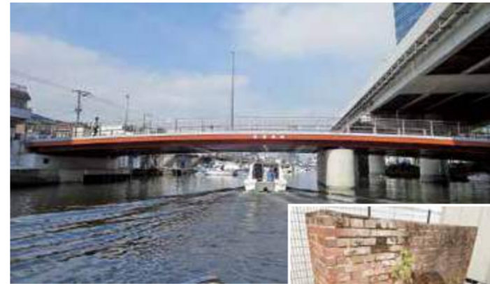
しんうらしまばし 新浦島橋 鋼橋 新浦島町1丁目 / 2018(平成30)年竣工・橋長49m

架けられた当時のままの姿で現存する市内の道路橋のうち、2番目に古い橋でしたが、橋としての役目を終え、現在は撤去作業中で立ち入ることができません。