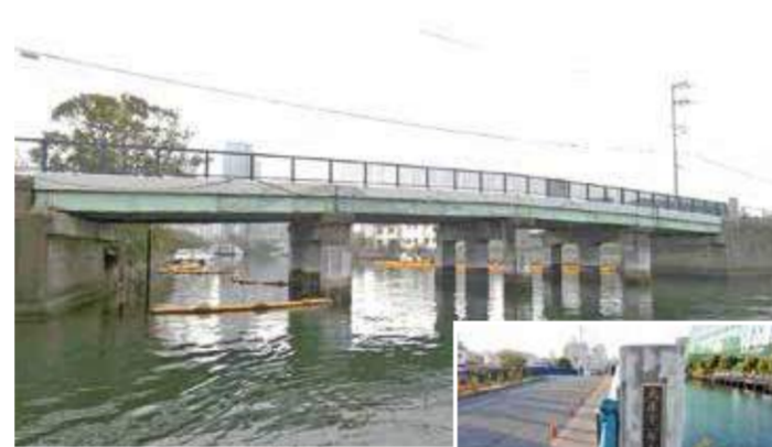
りゅうきゅうばし 龍宮橋 鋼橋 星野町 / 1923(大正12)年竣工・橋長38m

架けられた当時のままの姿で現存する市内の道路橋のうち、2番目に古い橋でしたが、橋としての役目を終え、現在は撤去作業中で立ち入ることができません。