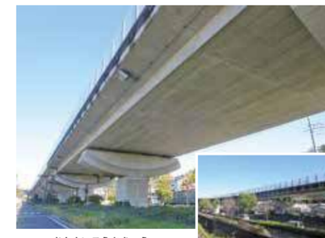
さんまいこうかきょう 三枚高架橋 混合橋 三枚町 / 橋長1,398m

山下長津田線や東海道新幹線をまたぐ橋。市内の道路橋のうち最も長い橋です。「JR新横浜駅」方面や国道16号方面への行き来が便利になりました。