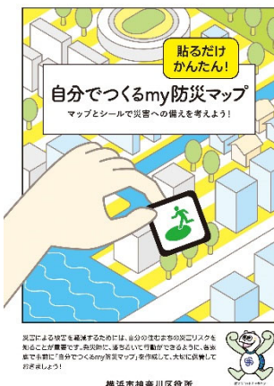
(1) ぼうさい じぶん 自分でつくる my ぼうさい 防災マップ