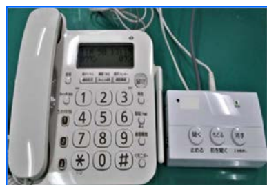
迷惑電話防止機能付電話録音機