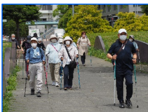
「ポールde歩こう会」活動の様子

高齢者が仲間と一緒に介護予防・健康づくりに取り組むグループ活動（元気づくりステーション）を支援しています。