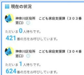
窓口の混雑状況Web画面