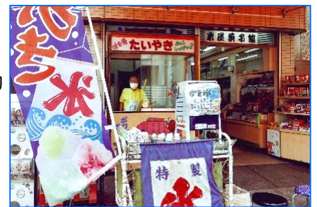
「わが町 かながわ とっておき」写真コンテスト 令和3年度小中学生部門最優秀賞 『アンコと思い出が詰まった駄菓子屋さん』