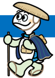
神奈川区マスコットキャラクター かめ太郎