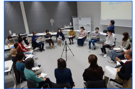
「第7期神奈川区地域づくり大学校」受講生による事例発表の様子