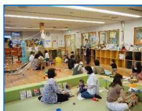
親子が楽しむ様子

就学前の子どもと保護者、子育て支援に取り組む人を支援します。区内には「かなーちえ」と昨年度オープンした「かなーちえサテライト」があります。