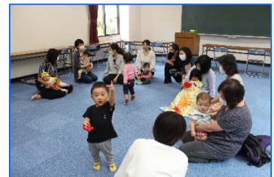
「すくすくかめっ子」で利用者が自由を楽しむ様子 (幸ヶ谷集会所)