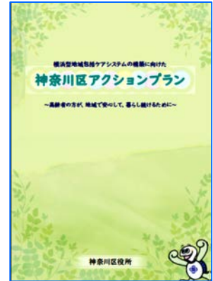
「神奈川区アクションプラン」