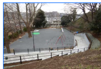
令和3年度に再整備した松見台公園