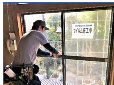
窓ガラス飛散防止フィルム 施工作業