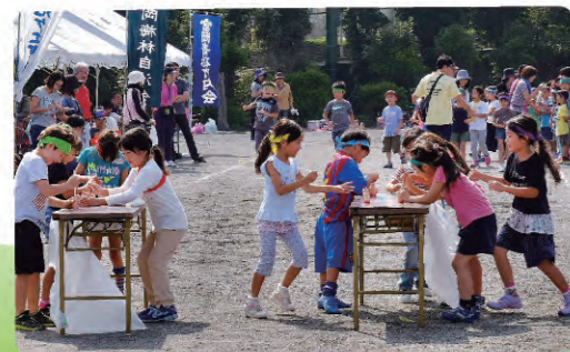
運動会 ヤクルト飲み競争