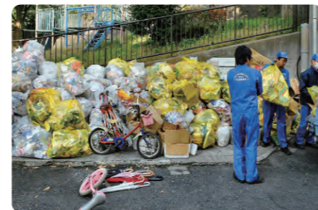
お元気お助け隊 ゴミ撤去