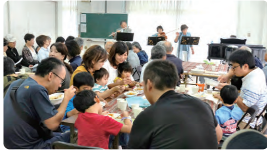
手作りカレー・イベントで楽しいひととき