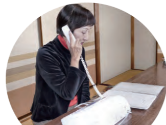
お元気ですかコール