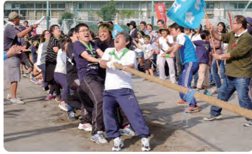
みんなで力を合わせて