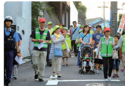
一斉パトロールで安心