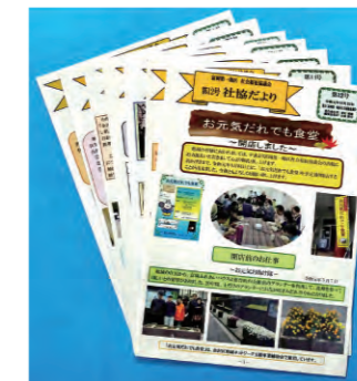
「社協だより」の発行