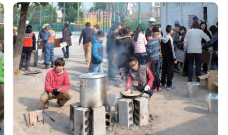
地域防災拠点防災訓練(小田小学校)