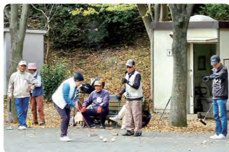
シニアクラブのみなさん