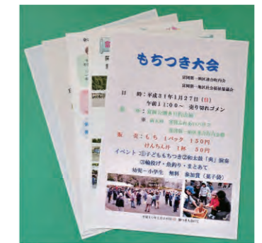
イベントチラシの発行