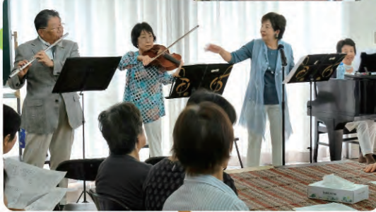
お元気だれでも食堂イベント