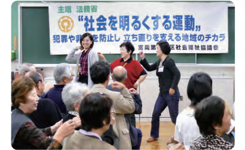
社会を明るくする運動大会