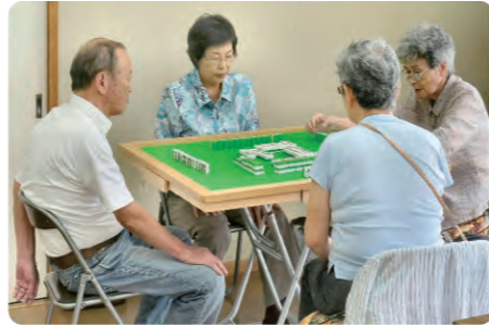
ふれあいマージャン