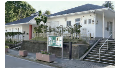
富岡ふれあいハウス・連合町内会館