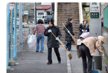
鳥見塚バス停清掃