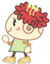
金沢区幸せお届け大使 ほたんちゃん