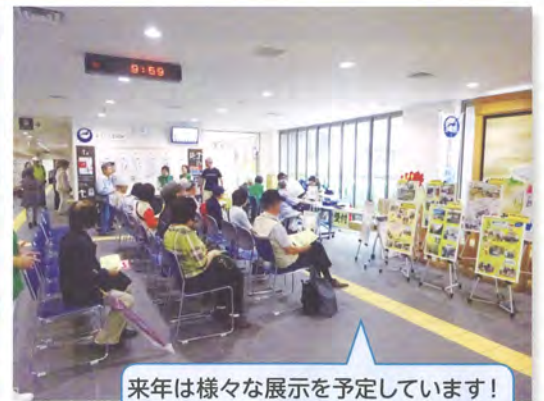
来年は様々な展示を予定しています!