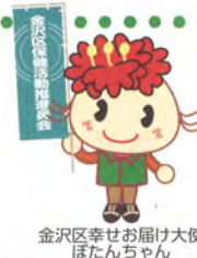
金沢区幸せお届け大使 ぼたんちゃん

保健活動推進員は、地域のみなさまのご理解ご協力のもと結成 70 周年を迎える事ができ、金沢区では 3 月 13 日に記念講演会を金沢公会堂にて開催いたしました。これからも、地域の健康づくりサポーターとして活動していきますので、引き続きよろしくお願いたします。