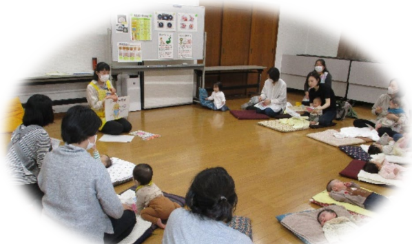
離乳食のお話の様子