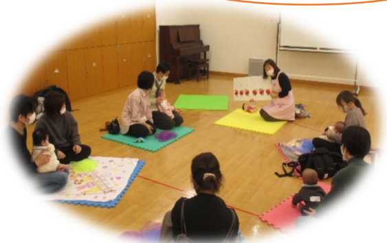
大きい絵本の読み聞かせ