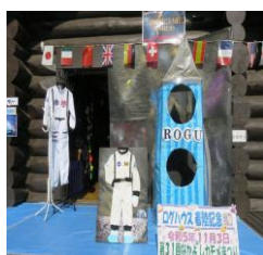
◎宇宙写真スポット

今年のテーマは、見て・遊んで・作って・楽しもう！！ログハウスの宇宙空間でした。秋を感じさせない夏のような暑さでしたが、天候に恵まれた一日となりました。館内では、工作やゲームをして賑わう子供達、館外では、模擬店やはれはれプレイパークを楽しむ声が聞こえていました。怪我や事故等もなく、来館者と共にスタッフ一同も楽しめたカモメまつりになりました。