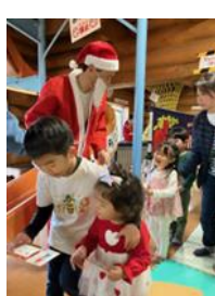
◎サンタからのプレゼント