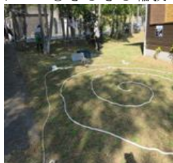
◎はれはれプレイパーク