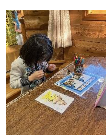
プラネタリウム工作