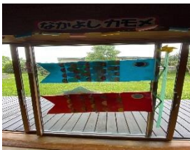
◎大窓に飾りました

ゴールデンウィーク期間中ということもあり来館者が多く、無料工作のマイこいのぼりと花束メッセージカードは共に好評で、限定 50 個ずつでしたが 4 日に終了となりました。また、こどもの日の雰囲気を少しでも保護者の方々や子ども達に味わってもらいたく、大窓や周りのスペースにこいのぼりや兜の飾りつけをしました。