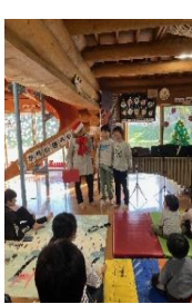
◎オーナメント工作