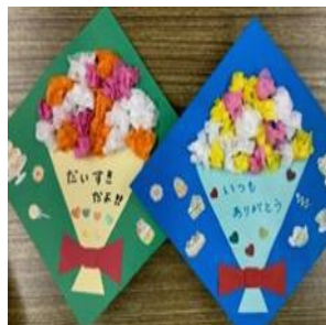
◎花束メッセージカード