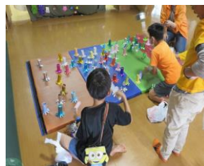
◎宇宙人キャッチャー