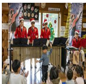
◎横浜市消防音楽隊の演奏