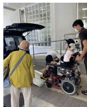
試走に出発、乗り心地の評価も良かった

大型のバギーを使用されている北綱島特別支援学校に通っている生徒さんはじめ、鎌倉から情報を得たいと来てくださったご家族もあり、情報発信の必要性を感じる一方、会場までの移動が容易なことではない重症心身障がい児者の足の確保や体調管理の難しさも併せて感じました。