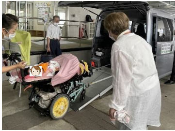
大型バギーの方もお試し

知的障がいのあるお子さんは、タクシーの一人乗車を楽しみに来てくださって、試走も体験されました。家族で対応が困難な際に、活用できそうです。