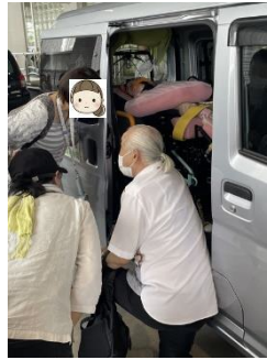
はじめて見た車内