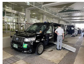
北綱島特別支援学校