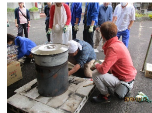
【炊き出し訓練の様子】

令和元年度も全利用者を対象に、「松風学園消防計画」による避難訓練を行いました。松風学園では、平成7年8月に学園、上飯田中村町内会と向ヶ丘自治会の3者で、「消防相互応援協力に関する覚書」を交わしています。内容は①消防隊が到着するまでの間の初期消火や入所者の避難誘導、②消防隊到着後の避難者介護等の支援活動です。これに基づき、利用者の安全な場所への避難誘導、安否確認、訓練の検証を近隣町内会とともに行いました。