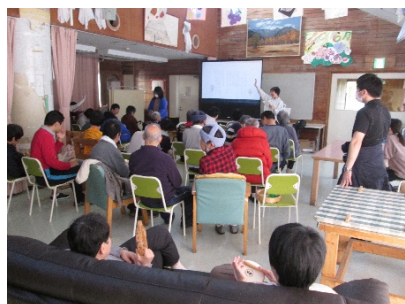
【感覚身体機能維持系】

また、お花見、収穫祭、寿司パーティーを企画する等、各棟独自にイベントも行いました。