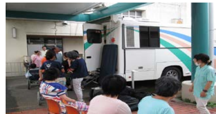
【レントゲン検診の様子】