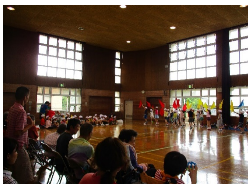
【上飯田小学校と交流会】

人権研修の場として当園を提供し、本市職員向けの研修として、総務局新採用職員研修（4名×2回、2人×1回）、健康福祉局新採用等研修（2名）、健康福祉局責任職人権研修（1回3グループ計20名）、泉区人権啓発研修（15名）を受入れました。