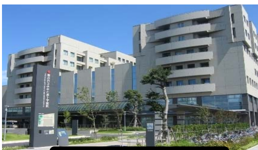
みなと赤十字病院