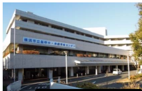
脳卒中・神経脊椎センター