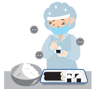
体調不良の人が調理

不顕性感染でも、感染者のふん便には多くのノロウイルスが含まれていますので、気づかないうちに感染を拡大させてしまいます。(ウイルスの排出は1か月程度続くことも!!)