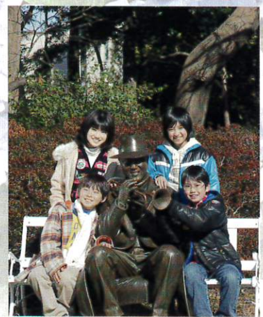
「おじさん公園のひみつ」