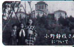
港北映像ライブラリより