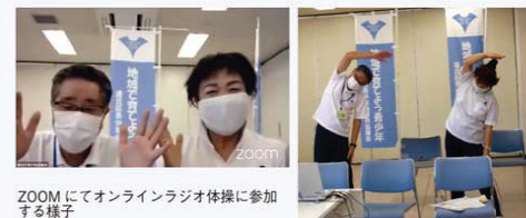
ZOOMにてオンラインラジオ体操に参加する様子

令和2年度より慶應義塾大学と港北区が連携して行っている夏のオンラインラジオ体操に、白石会長と吉田副会長がゲスト出演しました。早朝より区役所会議室に集まり、オンライン参加しました。最初は緊張していた2人も、徐々に緊張もほぐれ、楽しみながらラジオ体操と青少年指導員の活動紹介を行いました。(T. K.)