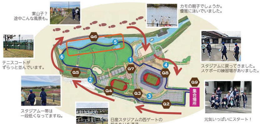
衆山子? 途中こんな風景も。

ちょうどこの日は日産スタジアムでイベントが行われており、人出も多かったのですが、舗装された道路をゆったりと歩くことができました。安全性も十分ですね。ミッションを確認しながら約5000歩、1時間くらいの行程でした。みなさんもぜひチャレンジしてみてください。(H. M.)