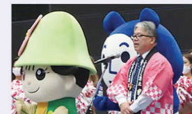
コアデイの生配信の様子