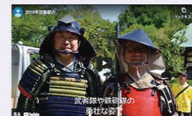
青指の活動を動画で紹介

また11月13日(土)はコアデイとして、横浜アリーナからの生配信が行われました。「あなたの夢を叶えよう！」のテーマのもと、チアリーディングチームや地元高校生の書画パフォーマンスなどが披露され、新型コロナウイルスに負けないオンラインならではのイベントになりました。(H. M.)