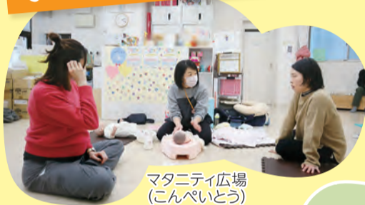
マタニティ広場 (こんぺいどう)