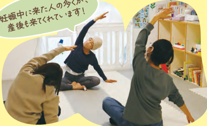
マタニティヨガ(「たかたんのおうち」)