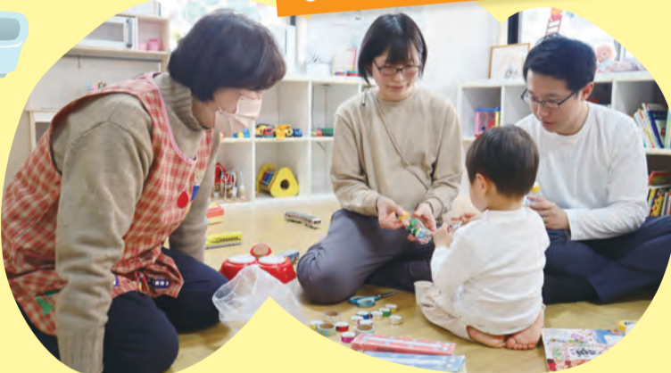
「ガラガラ作り」土曜日広場へようこそ (つどいの広場ぽけ)