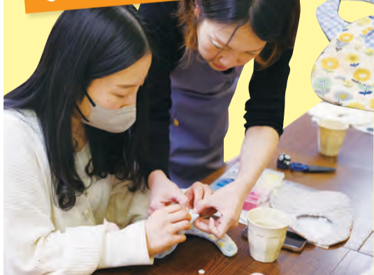
マタニティソーイング(親子の広場ビーのビーの)