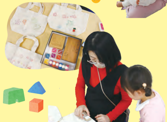
プレパパ・プレママの交流会(ひだまり)