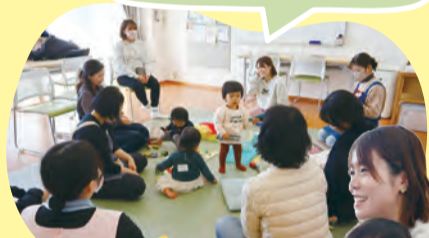
出産準備プログラム (どろっぽ)

妊娠中に参加して施設の様子が分かっていたので、産後もすぐに利用することができました