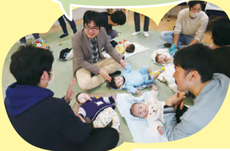
どろっぽ (どろっぽサテライト)

知り合いがいなかった場所での子育てで心配でしたが、父親同士で話ができる場所が見つかり安心しました