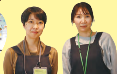
～ようこそ、プレママ・プレパパ～ (子育て支援スペースCOCOひよし)