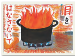
2023年の最優秀作品 (港北火災予防協会長賞)