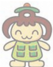
高田地区キャラクター「たかたん」

「わた史ノート」は、港北区内地域ケアプラザや港北区役所高齢・障害支援課(1階11番窓口)でご希望の方に無料でお渡ししています。