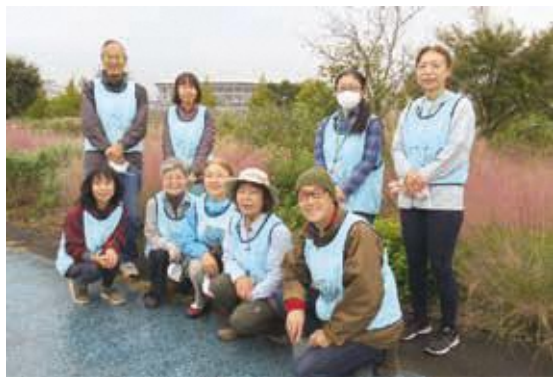
維持管理を行うメドウガーデンクラブの皆さん

「游学スポット」ならび「登録グループからの会員募集」の締切は 12月28日(火) です。概ね2022(令和4)年2月10日～4月10日迄 のイベント情報をお寄せください。詳しくは区民活動支援センターまで！