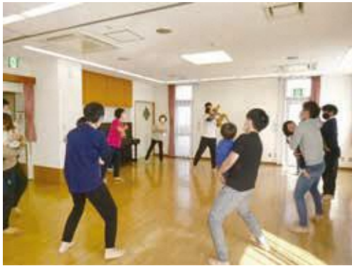
パパと体操の様子

地域ケアプラザは、デイサービスもしているから高齢者施設？と思われるがちですが、実は、子育て中のパパやママも応援しています。