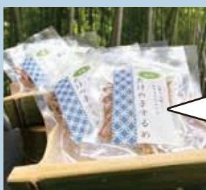
竹ファンショップで販売中！

また、竹文化の継承を図るため、竹に触れて、竹を見直すきっかけづくりになればと「竹の学校」を定期的開催。学んだ技術や技能が竹林の保全と活用や、趣味や生きがい作りに活かされることを目的としたプログラムになっています。