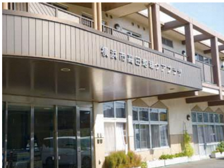
高田地域ケアプラザ 外観

住 所:横浜市港北区高田西2-14-6 電 話:045-594-3601 FAX:045-594-3605 開館時間:月曜日～土曜日 9時～21時 日曜日・祝日 9時～17時 休 館 日:毎月第1月曜日 年末年始(12月29日～1月3日) 交 通:市営地下鉄グリーンライン「高田駅」下車 徒歩2分 バス停 高田地域ケアプラザ前 徒歩1分