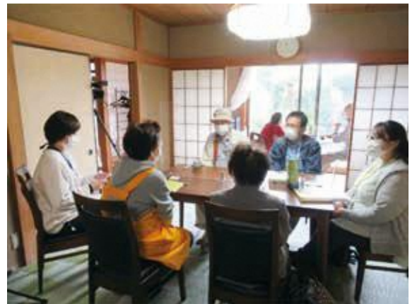
ゆずの樹出張相談会の様子

今回のテーマは「わた史ノート」(港北区版エンディングノート)。社会福祉士から1ページずつ詳しい説明がありました。周りに伝えておきたいことを事前に書き記しておくことで、自分も周りも安心できます。「大事にし過ぎて、どこに片付けたか分からなくならないように、ご家族にも置き場所を伝えておいてくださいね。」という言葉に参加者から笑いが起きていました。