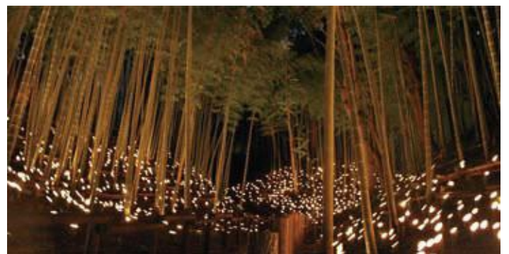
竹灯籠の灯りが揺らめく幻想的な景観

まつり当日、斜面に設置された灯籠に火を灯すボランティアを「あかりびと」と呼びます。どなたでも参加することができます。みんなで力を合わせて出現する幽玄の世界。灯りが燈ったときの感動は、忘れられないものになるそうです。