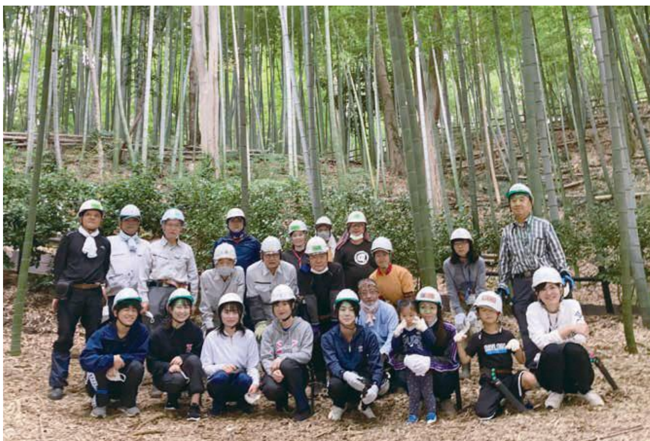
(日本の竹ファンクラブ「竹取協力隊」と市民ボランティアの皆さん)

竹林の保全と活用で、地域まちづくりを推進する 特定非営利活動法人「日本の竹ファンクラブ」