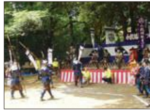
小机城址まつり(2019年撮影)

〈集合〉小机駅改札前 〈解散〉新横浜駅前公園(約5キロ) 協力：港北ボランティアガイドの会