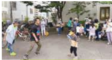
「プレイキンチーム」のダンス披露(5月21日) 飛び入り参加?! のキッズと手拍子で見守る参加団体代表(右端)