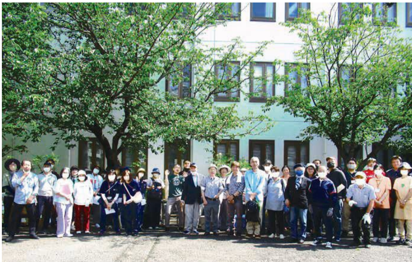
(らくらく市実行委員会の皆さん 5月21日、開始70分前)