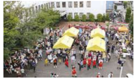
「らくらく市」当日のにぎわい