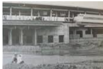
「1968年の新横浜駅前」