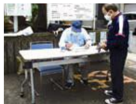
30分前:団体受付・総合案内スタンバイ