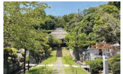
四季の自然豊かな西方寺 (写真は夏の様子)

実施日:11月25日(土) 集合時間:9:30 集合場所:市営地下鉄ブルーライン北新横浜駅 エスポルト前広場 参加費:500円(保険料等) 募集人数:60人(応募多数の場合は抽選) 応募方法:応募フォームまたは往復はがきに①ツアー名「花と木3」②〒住所・氏名(ふりがな) ・年齢・電話番号(複数人の応募の場合は全員の氏名(ふりがな)・年齢)③返信用 はがきの宛名にご自身の〒住所・氏名をご記入の上、区民活動支援センターへ 応募締切:11月9日(木)※はがきで応募の場合は必着