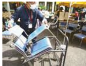
60分前:誰でもひと休みできる場所をテント内に設置