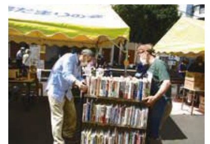
60分前:人気の古本市も復活!ご家庭の本棚整理と港北図書館の蔵書充実役に立っています