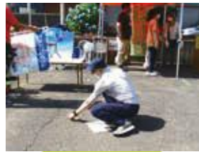
120分前:まずは計測して区画割り

各ブースだけでなく、来場者用休憩スペース作りにもぬかりがありません。それぞれが準備に追われる中、お互いに声をかけあい、気持ちを高めあっている光景がありました。