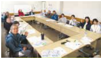
準備会議(4月3日) 出展場所はくじ引きで決まります。各団体からの近況報告も聞き合いました。

また、参加団体より、ラブジャンクス(ダウン症のある方の世界初のエンターテイメントダンススクール)にも所属する利用者さん(プレイキンチーム)から、ダンス披露の希望があるのだが、できるだろうか？との意見がありましたが、満場一致で快諾されました。