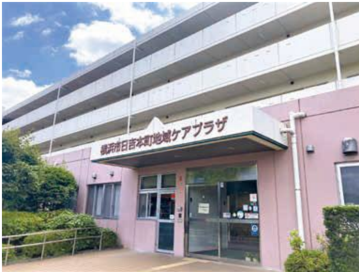
日吉本町地域ケアプラザ外観

集合住宅の1階部分という決して広々としたスペースではないけれど、ご近所さんがふらっと立ち寄って、気軽に活動したり、相談できる場所として定着している「日吉本町地域ケアプラザ」の取り組みをご紹介します。