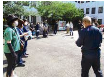
80分前:円陣に集合して、事務局からの連絡事項を共有します