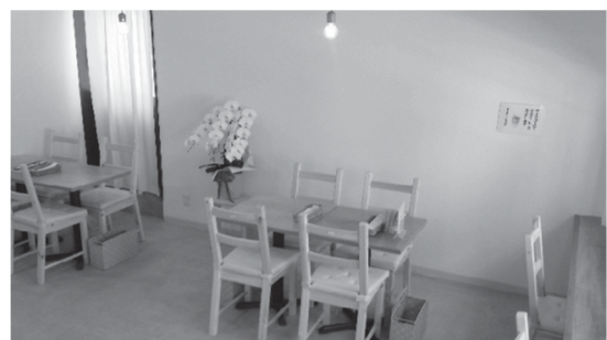
「カフェおからさん」の店内の様子

掲載以外のコミュニティカフェをご存じの方は、 区民活動支援センターまでお知らせください!