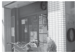
「大倉山おへそ」の外観

チラシやスタッフの声掛けなどによる情報発信のほかに、小学生が地域を取材・編集し、年2回発行する「大倉山キッズ新聞」によって地域の情報を得ることができます。スペースを借りているサークルや団体によって開かれている「うたごえサロン」や「英会話カフェ」、スマホやパソコン講座は地域の人々にとって大切な学びの場にもなっています。