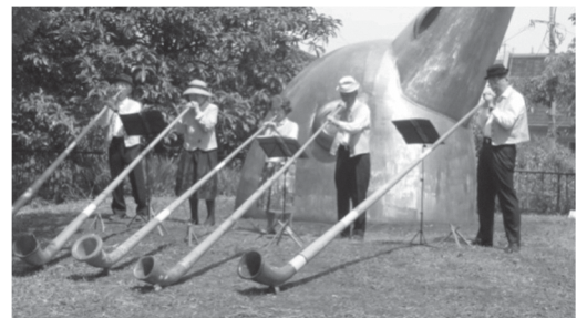
(アルプホルンの演奏風景)

会場では、松の川緑道で採れた葉を使用した手作りの飲み物が無料で配られていました。また、松の川緑道に生息する野生動植物の写真や、野生動植物をモチーフにしたオリジナルのキルトも飾られていました。