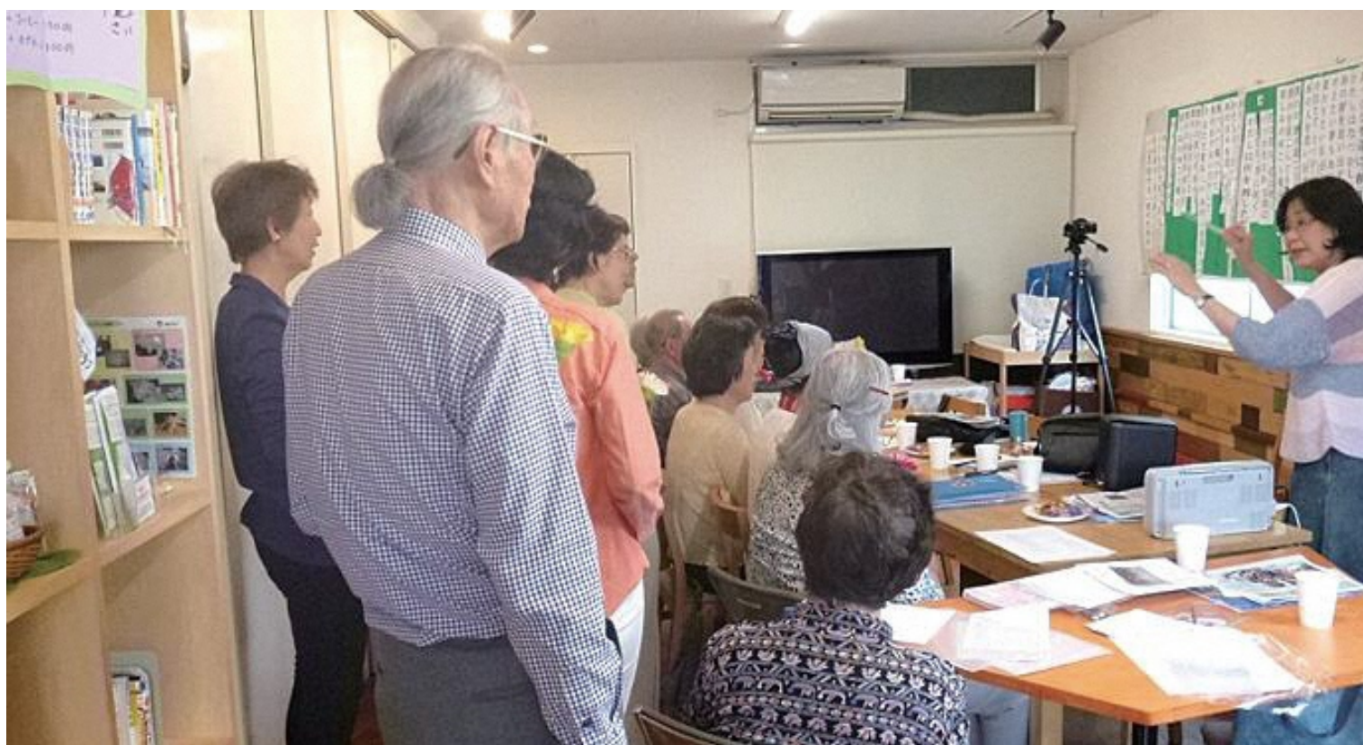
大倉山おへそ 大倉山うたごえサロンの様子