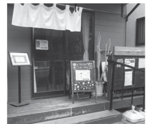
「大倉山ミエル」入口

大倉山ミエルは、気軽にお茶やランチを楽しめるカフェです。現在10名ほどのスタッフが協力しながら調理や運営にあたり、地域に住むシニアの方などへお弁当の宅配も行っています。一方で、近隣に住む高齢者の支え合いの場として、毎週月曜日には、要支援・介護1・2の方や地域のシニアの方々が集う場「おでかけミエル」を開いています。お茶やランチを味わいながら談笑したり、歌を歌ったり...人々が集ってゆるやかな時間を共有することで、自然に互いに支え合う空気が育まれています。第2水曜日には、「認知症カフェ」も開かれています。情報発信とともに、「ミエル」は地域の人々の生活支援の拠点にもなっています。