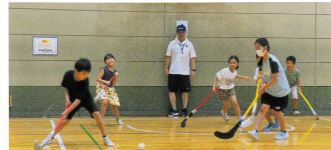
夢中になり、活発に動く子どもたち。(ユニホック)

7月21日(日)、港北スポーツセンターで開催。参加者はのべ384人と昨年の1.4倍近くに増えた。小学4年生以下が約9割で、ユニホック、ポッチャ、タグラグビーなどは、初体験だった者も多かったようだ、夢中になっている姿が見られた。保護者からは「子どもの年齢や体調に合わせて自由に好きなスポーツを選べるのが良い」、「短時間ながら色々な種目が楽しめた」、「子ども達