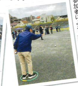
参加者による入魂の投球!!