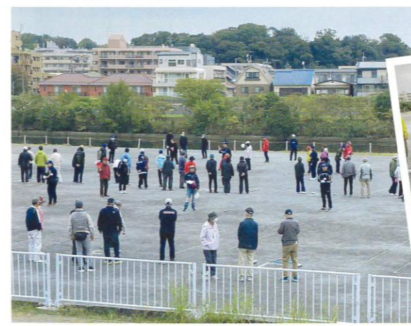
スポ進は審判等の運営で従事しました。

ペタンクとは、金属製の球を投げたり、転がしたりして、目標の球により近づけるかを競う、フランス生まれの簡単なスポーツです。港北区スポーツ推進委員連絡協議会では「年齢を問わず、だれでも楽しめる」生涯スポーツとして普及活動に取り組んでいます。