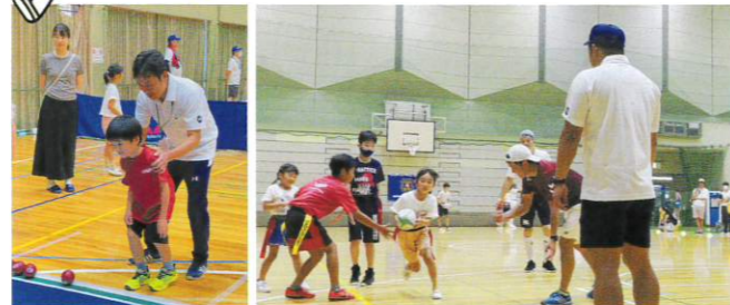
子どもたちを見守り、指導をする委員たち(左:ポッチャ/右:タグラグビー)

開催日 7月21日(日) 会場 横浜市港北スポーツセンター スポ進動員数 37人