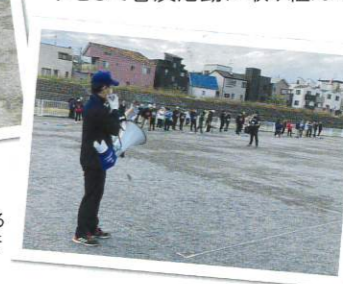
大会委員長による円滑なマイク進行