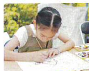
お絵かきマイバッグ