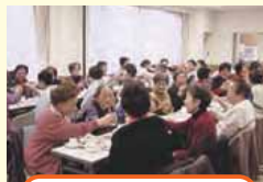
ひとり暮らし食事会

小・中学校を拠点とし、大地震に備え避難訓練・機材取扱訓練・消火活動・救命訓練・危険箇所の点検と対策などを行っています。あわせて重要課題として、要援護者支援体制の確立を目指しています。