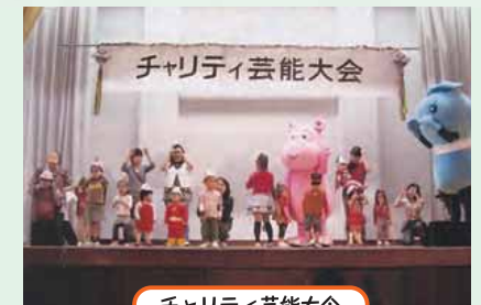
チャリティー芸能大会