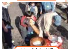
もちつき大会の様子