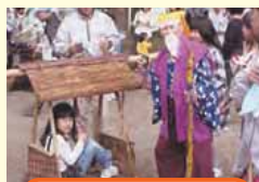
青少年指導員活動