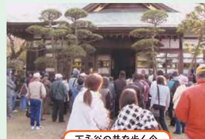
下永谷の昔を歩く会