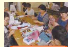
消費生活推進員活動