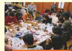
環境事業推進委員活動