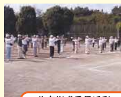
体育指導委員活動