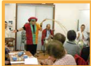
▲サロン活動(雑色南)