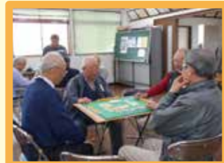
▲健康マーじゃん(雑色)