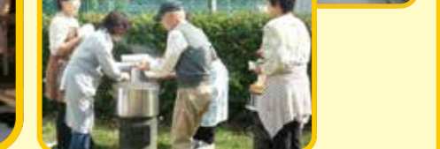
▲防災訓練での炊きだし(笹下ハイツ)