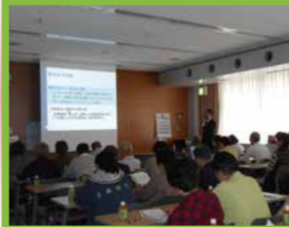
▲認知症の理解講演会