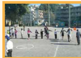
◀グランドゴルフSKYジュニア

SKYは日下地域の青少年のボランティアグループ! 地域のイベントなど様々な場面で活躍中!