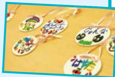
▲障がい児の作品(ぼかぼか)