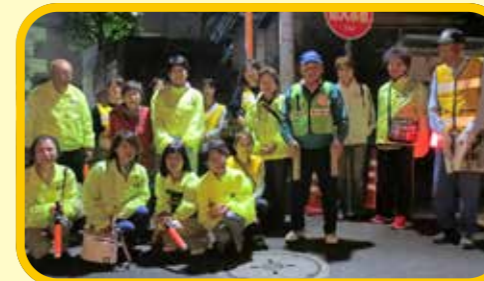
▲防犯パトロール(関)