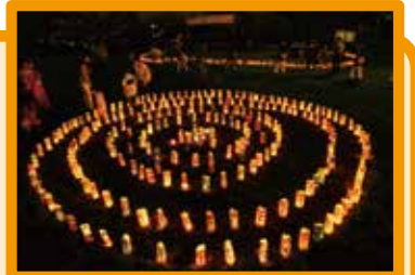
▲キャンドルナイト(雑色)