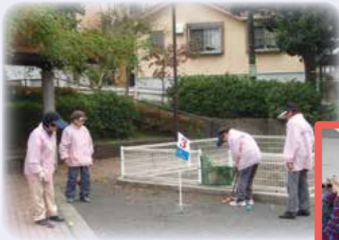
▲グランドゴルフ(グリーンタウン)