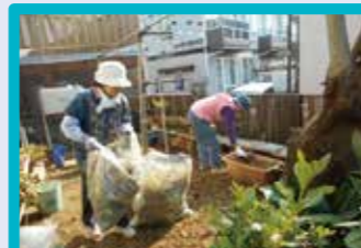
▲福祉ネットワーク「ピープル日下」