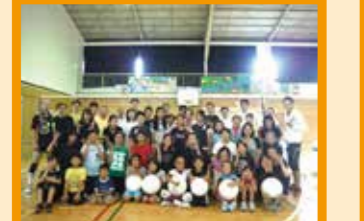
▲ファジーバレーボール