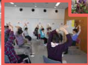
▲町ぐるみ健康づくり教室