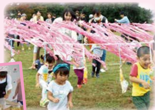
▲わくわくちびっこ運動会