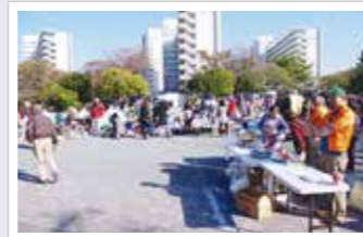
◀福祉フェスタ&チャリティバザー