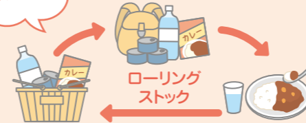
ローリングストック