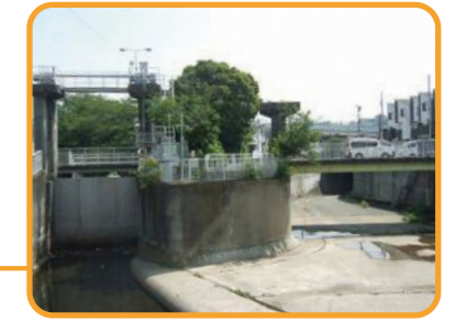
左側水門のあるところが日野川の本流 右側分水路

日野川取水庭 大岡川の洪水対策として、笹下の取水庭と一体となっている。日野川と笹下川の合流する地点(笹野橋公園)からそれぞれ約1km上流の場所に取水庭が造られた。昭和44年着工、昭和56年に完工。総工費166億円。 追加情報 日野取水庭の分水路は環状2号線の下をトンネルで流し、磯子屏風ヶ浦で根岸湾に流出している。