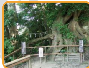
横浜市指定有形文化財 社叢林は横浜市指定史跡 名勝天然記念物